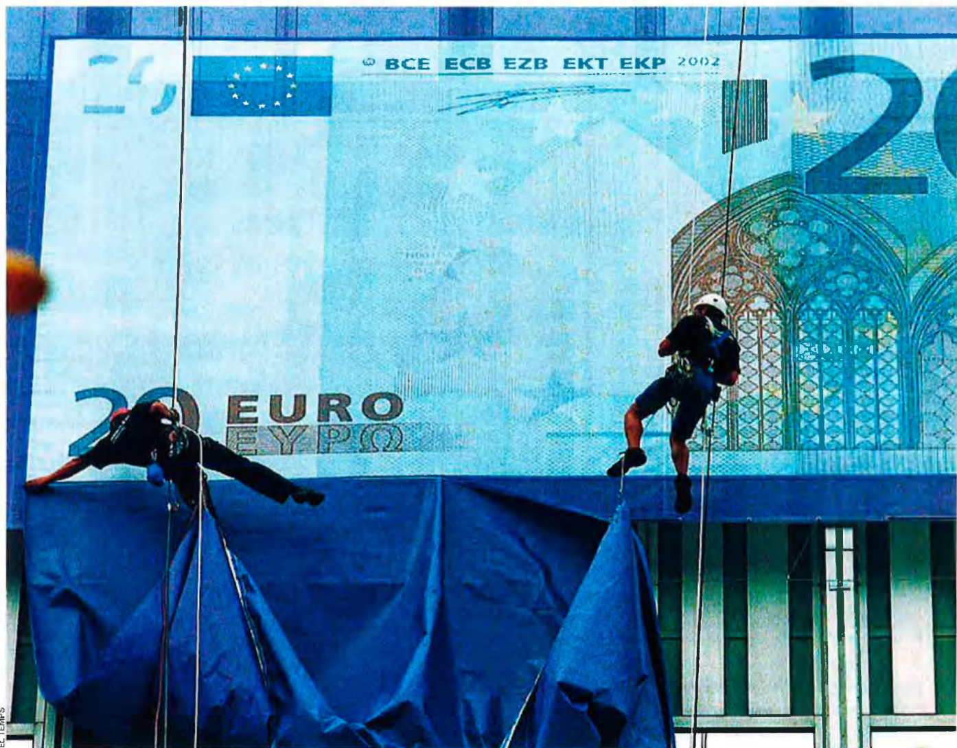
Anunci de l'euro al Banc Central Europeu a Frankfurt el 2001.

prometre millores. El canceller parlava als vestíbuls d'ací i d'allà i tingué durant molt de temps carta blanca.