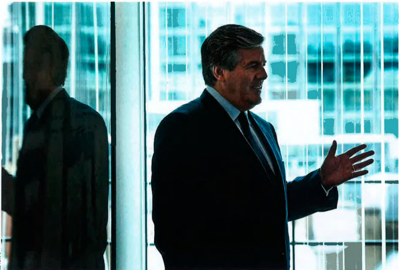
El director del Deutsche Bank, Ackermann: a Atenes com a Intermediari.

països membres. Segons aquests, cap país no podia acumular més d'un 60% de deutes segons la mesura del producte interior brut (PIB). Només es podien agafar nous crèdits si el volum del préstec no superava el 3%. "Tres coma zero és tres coma zero", deia la norma de Waigel. Les infraccions s'havien de sancionar rigorosament.