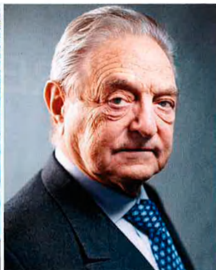
George Soros és un inversor llegendari des que el 1992 va fer una fortuna especulant contra la lliura. El seu fons és acusat d'haver acordat amb uns altres fons un atac a l'euro.

Des del principi molts no ho mantingueren.