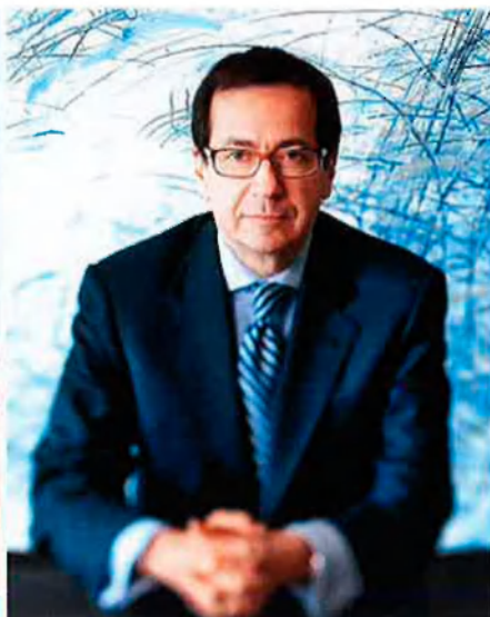
John Paulson ha guanyat milers de milions perquè va jugar fort, en el moment oportú, pel final de la bombolla immobiliària americana. L'any passat va apostar pel retorn dels bancs nord-americans; ara vol guanyar diners amb la crisi de l'euro.