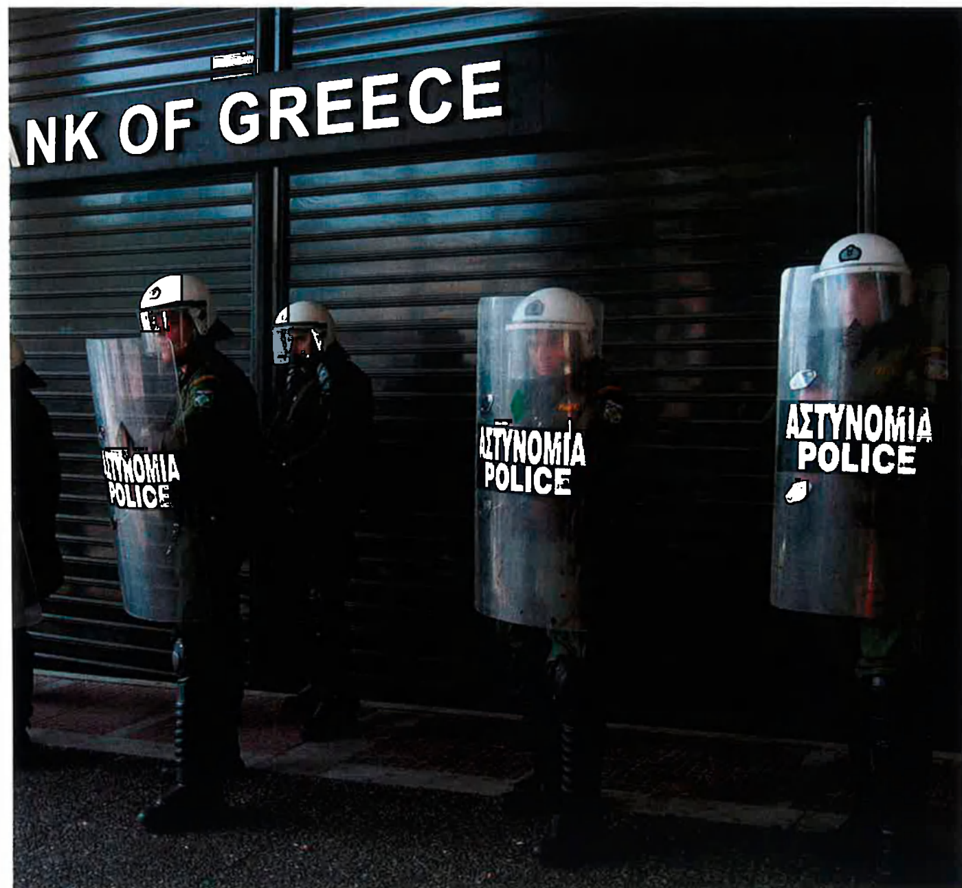
Polícies grecs davant una filial bancària a Atenes: guerra de nervis pel poder i els milers de milions d'euros.

internacionals, sinó als despatxos governamentals d'Atenes, Madrid, Berlín o Brussel·les. O bé han fet servir l'euro per a viure a costa dels altres a còpia d'enganyis i falsificacions, o bé, a posta, s'han aclucat d'ulls.