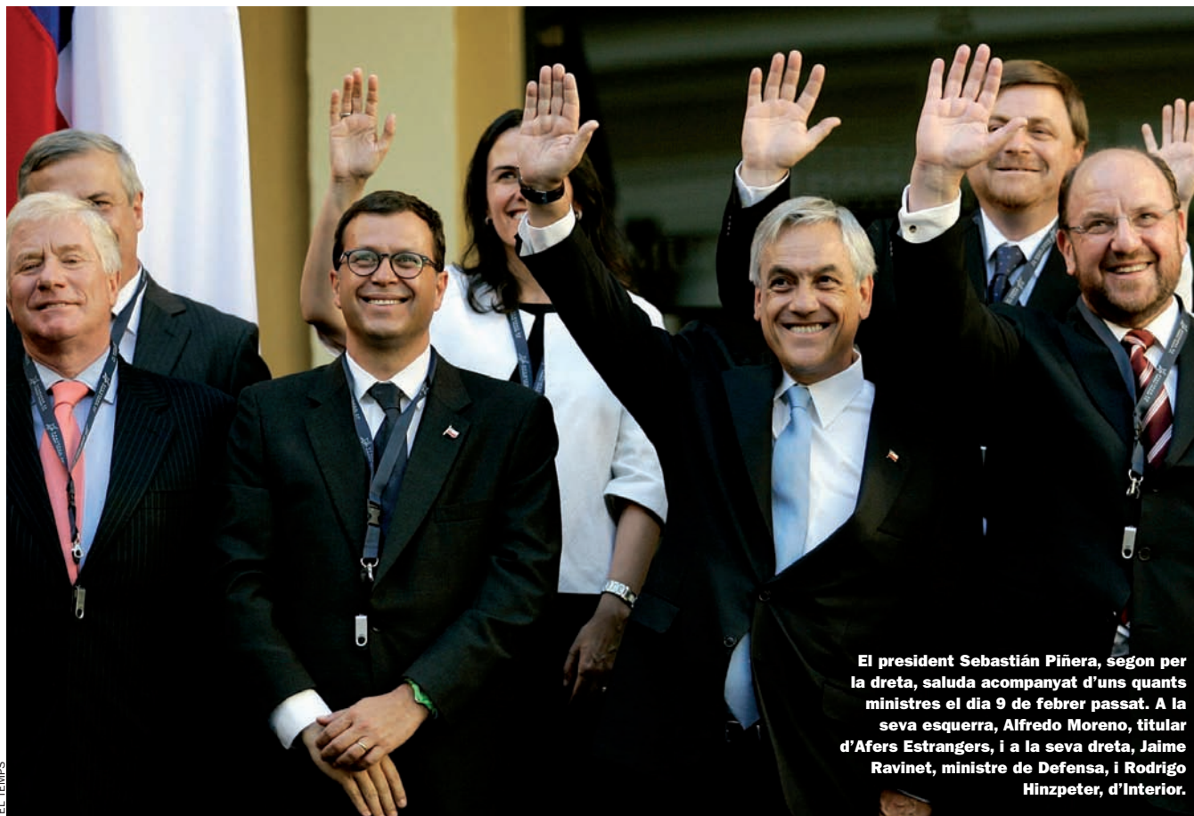
El president Sebastián Piñera, segon per la dreta, saluda acompanyat d'uns quants ministres el dia 9 de febrer passat. A la seva esquerra, Alfredo Moreno, titular d'Afers Estrangers, i a la seva dreta, Jaime Ravinet, ministre de Defensa, i Rodrigo Hinzpeter, d'Interior.

La pujada al poder de la dreta a Xile ha modificat el color polític de l'Amèrica Llatina. Alguns països, com ara el Perú o Colòmbia, celebren que hi hagi un nou membre a l'eix anti-Chávez; alguns altres, però, veuen amb temor que el 'fenomen Piñera' pugui estendre's.