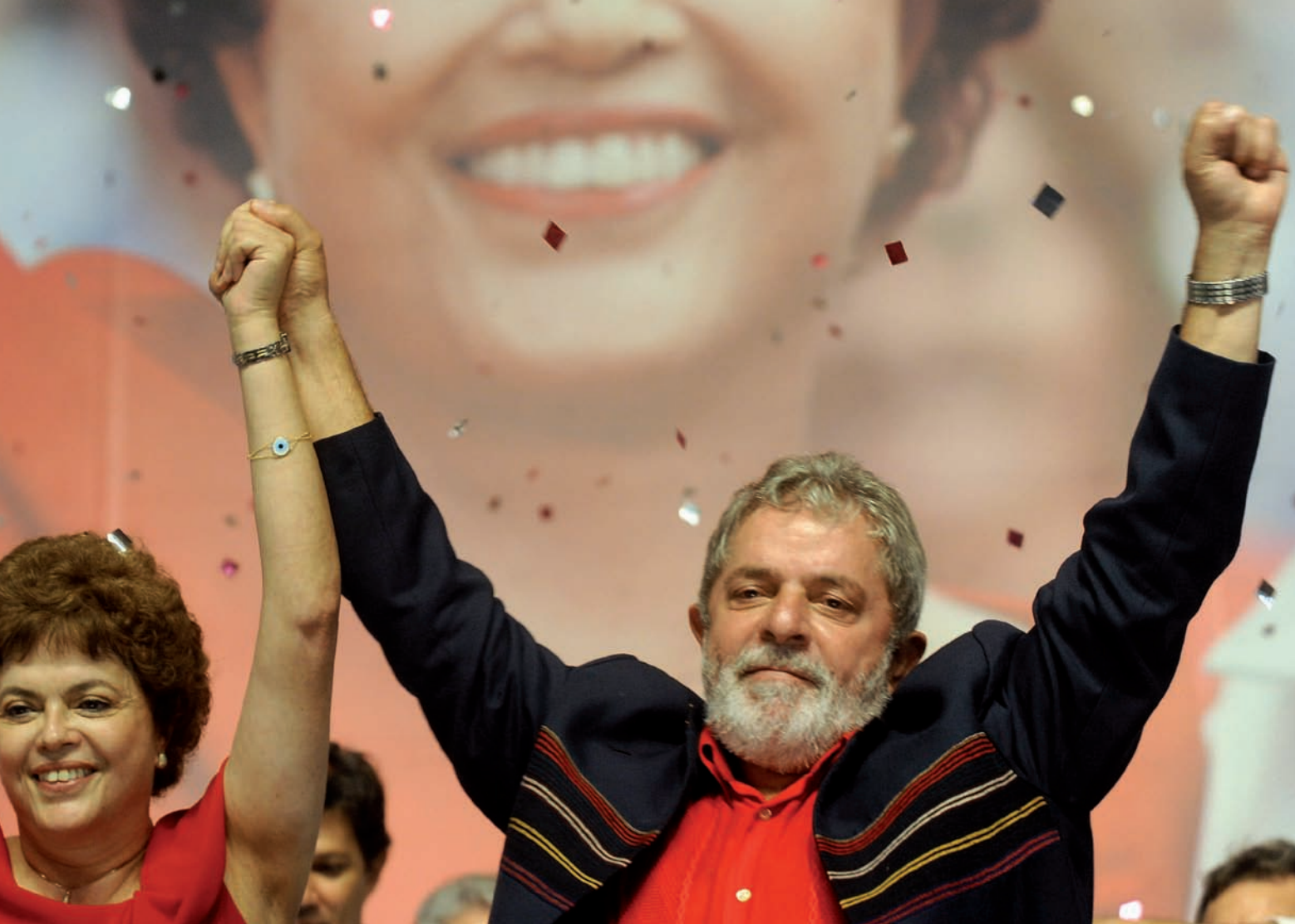
Silva, aixeca el braç de Dilma Rousseff, proclamada candidata a succeir-lo, el dia 20 de febrer passat a Brasília.

segona volta per Lula da Silva. Després d'aquesta derrota, Serra va esdevenir alcalde de la ciutat de São Paulo i tot seguit va guanyar les eleccions a governador d'aquest estat, l'any 2006. A São Paulo, considerat la locomotora del Brasil , perquè concentra el 33% del PIB de tot el país, Serra hi ha aconseguit de millorar els serveis públics i disminuir els índexs de criminalitat.