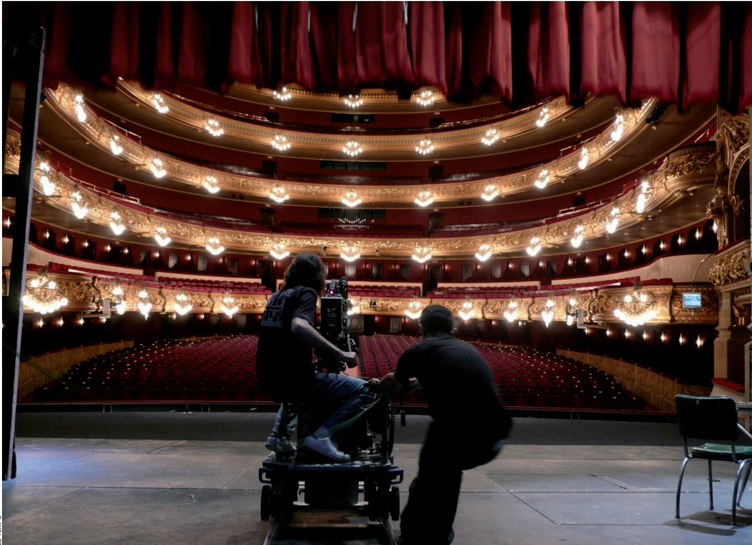
Rodatge del documental La bomba del Liceu , de Carles Balagué (2010).