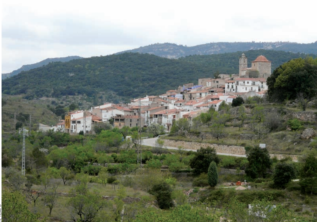
La Pobla de Benifassà, coronada per l'església.

“Volen un creixement desaforat, irreal. Pretenen construir en pocs anys allò que ha tardat 800 anys a consolidar-se, amb el perill que ens passe com a la vall Fosca”, diuen des de l'ART, on veuen amb la mateixa preocupació la Porta de la Tinença i el creixement urbanístic proposat per a cadascun dels municipis. L'oposició al PGOU que ha aprovat el ple municipal (amb els vots dels cinc regidors del PSD) els costa més d'un disgust personal i la incomprensió d'alguns veïns que veuen en la requalificació de terrenys una opció de futur. Se senten observats, diuen. “Ens van enviar un espia, un xic xilè que es va posar en contacte amb nosaltres amb l'excusa que feia un