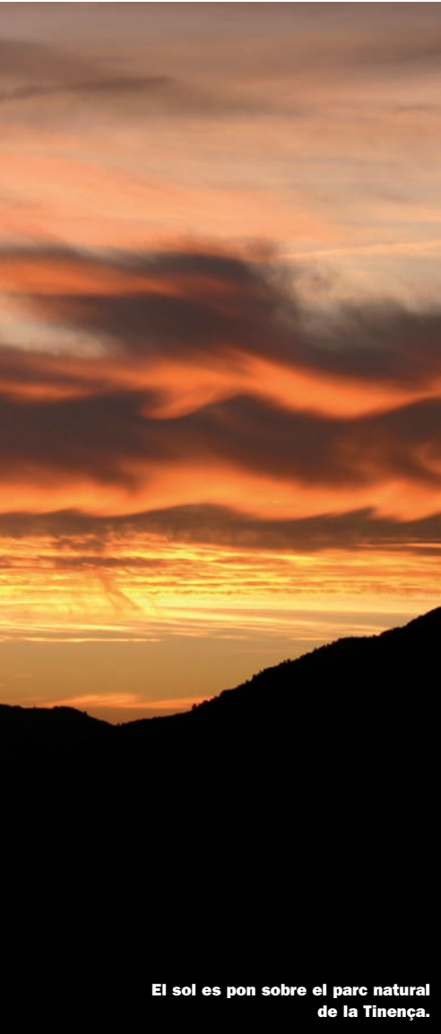
El sol es pon sobre el parc natural de la Tinença.

Per tot això, la Pobra no és un lloc convencional. Per això, i per molt més. Perquè la Pobra, amb la seua esplendor ben bé virginal, no ha restat al marge de l'especulació urbanística a què aquesta darrera dècada ens hem acostumat. També ací, si bé amb una miqueta de retard, hi ha hagut tripijocs de dubtosa legalitat i passatges foscos lligats a la febre del totxo. Un ex-regidor del PP que es passa al Partit Socialdemòcrata, un cens electoral que s'engreixa inexplicablement, un pla general d'ordenació urbana (PGOU) per aprovar i un promotor que és oncle de l'alcalde i desitja construir siga com siga: són elements suficients per a lligar una trama més pròpia d'una zona costanera, però que, precisament perquè parlem d'una àrea d'interior, ha passat pràcticament