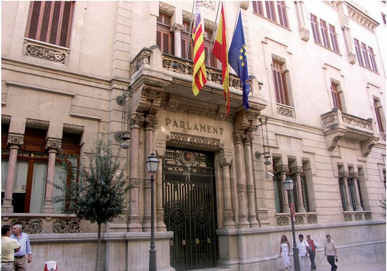
La minoria parlamentària del govern fa preveure que perdrà, com ja ha començat a passar, moltes votacions a la cambra.