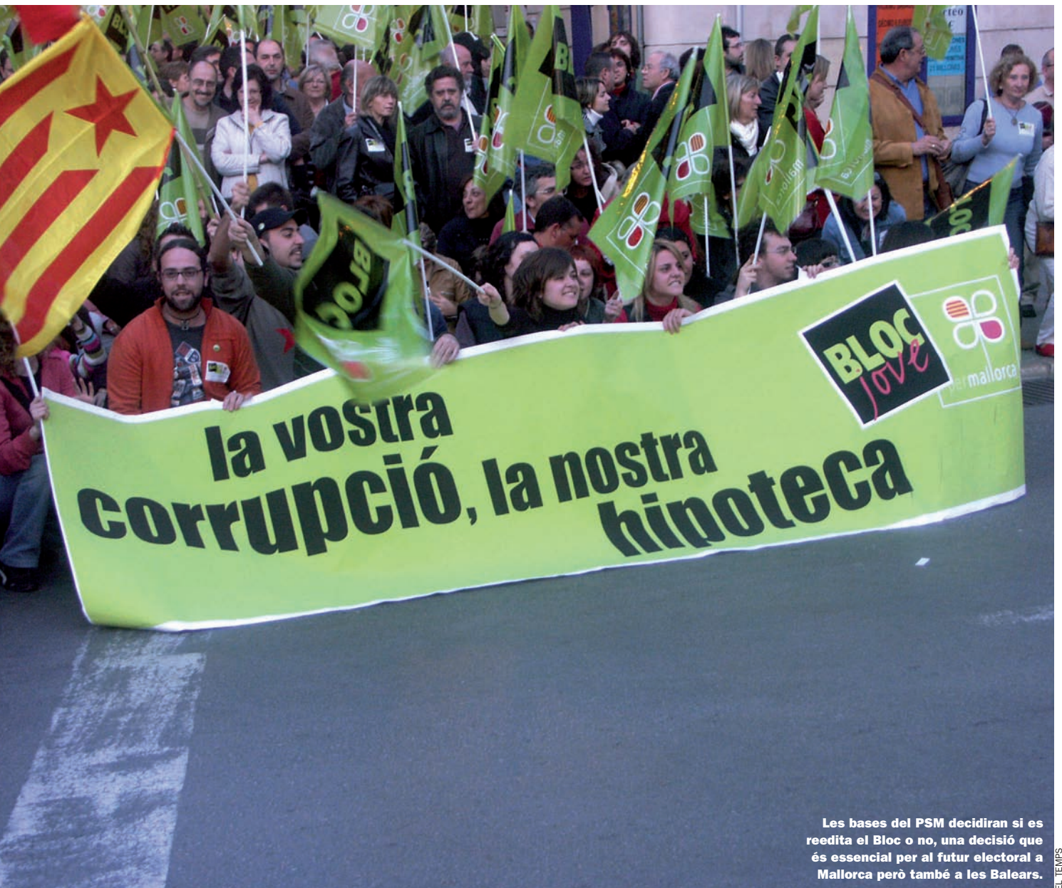
Les bases del PSM decidiran si es reedita el Bloc o no, una decisió que és essencial per al futur electoral a Mallorca però també a les Balears.