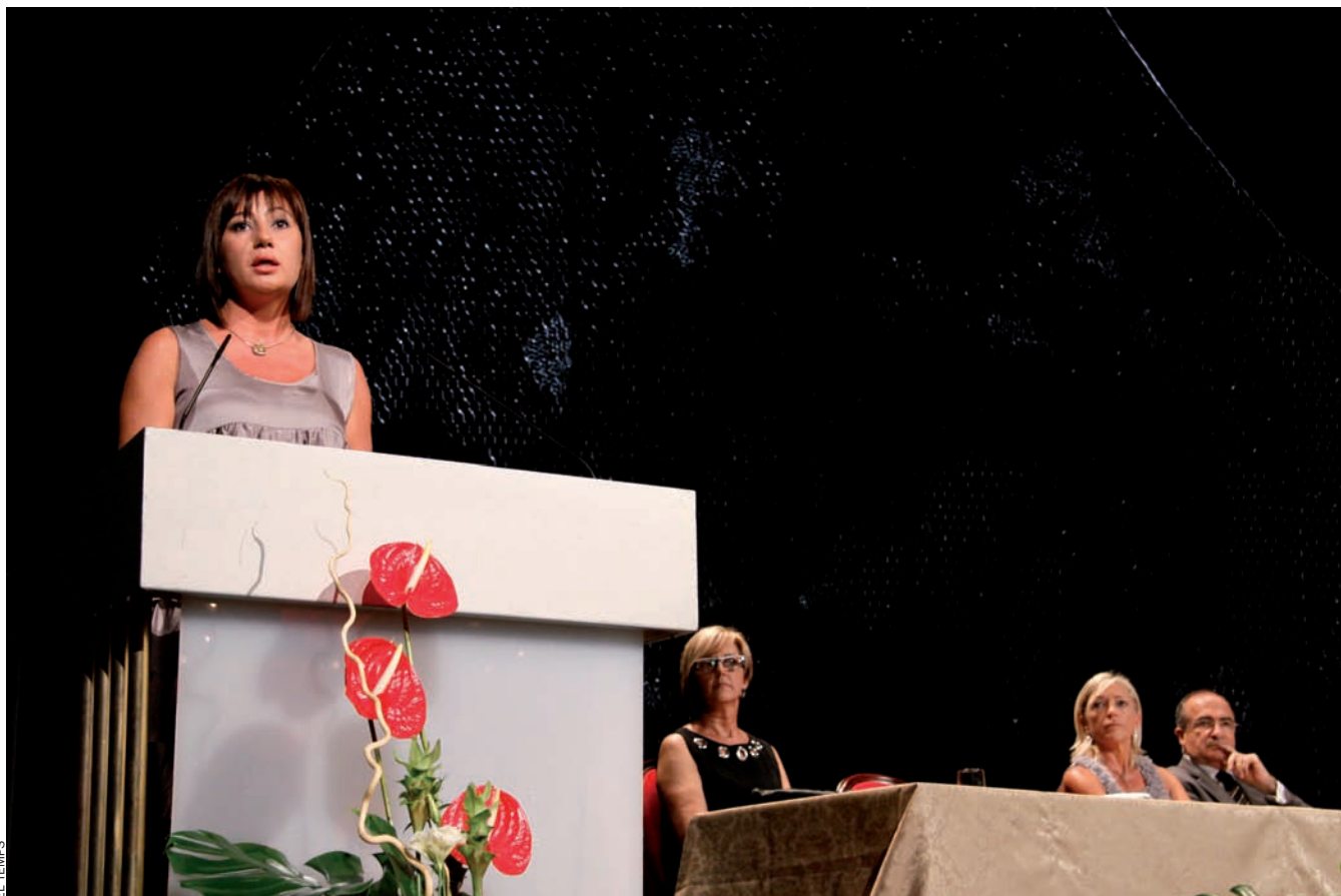
La presidenta del Consell de Mallorca, Francina Armengol, va aprofitar l'acte central de la Diada de Mallorca de l'any passat per carregar contra la corrupció.

El Bloc. La gran incògnita de la política mallorquina amb vista al futur immediat, més enllà de la gestió del Consell, és si el Bloc per Mallorca es repetirà o no, una decisió que bàsicament hauran de prendre el PSM i EU –vegeu què en diuen els dirigents, entrevistats en aquest dossier. D'allò que decideixin finalment, en dependrà probablement el seu futur electoral. Però no tan sols això, sinó que aquesta decisió determinarà qui podrà formar govern, tant al Consell de Mallorca com a les Balears. Val a dir que la coalició també la formen Els Verds i ERC –si bé els independentistes se n'anaren del pacte tot i que hi donen suport al Consell–, però tenen un pes molt menor als altres dos.