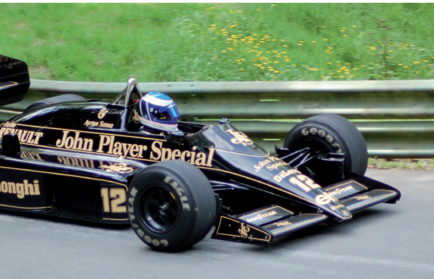
de la fórmula 1 durant els anys 70 i 80 del segle XX, gràcies al patrocini de la marca de cigarretes John Player Special.

pai suposadament lliure de fum. Ja que parlem de prohibició de fumar en llocs públics, un recordatori històric: durant la Segona República, l'estat espanyol fou el primer de tot Europa que prohibí de fumar a teatres i a cinemes.