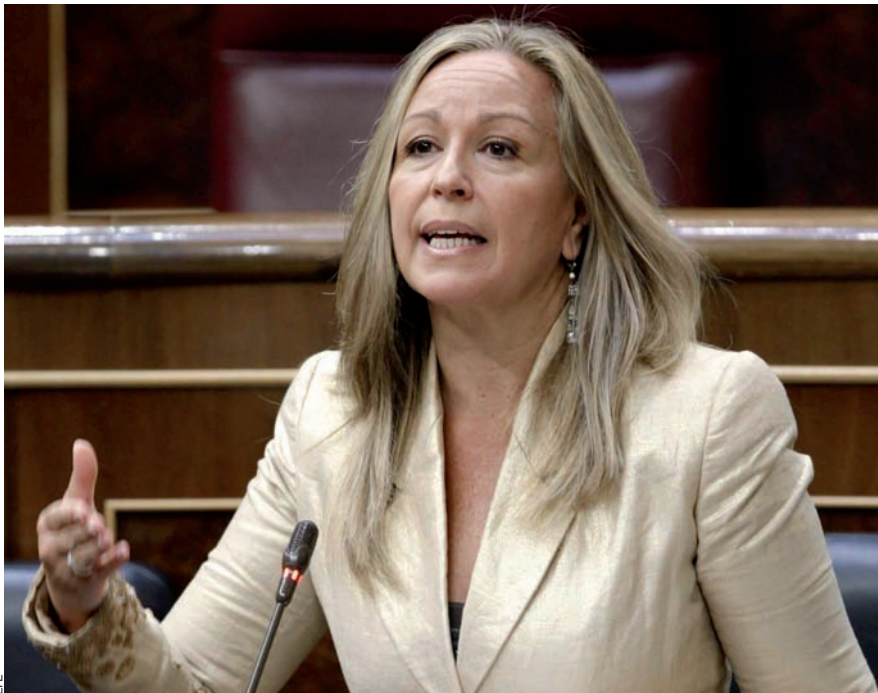
La ministra espanyola de Sanitat i Consum, Trinidad Jiménez, ha anunciat que enguany s'ampliarà la prohibició de fumar als espais públics tancats, tal com ja han fet molts estats europeus.