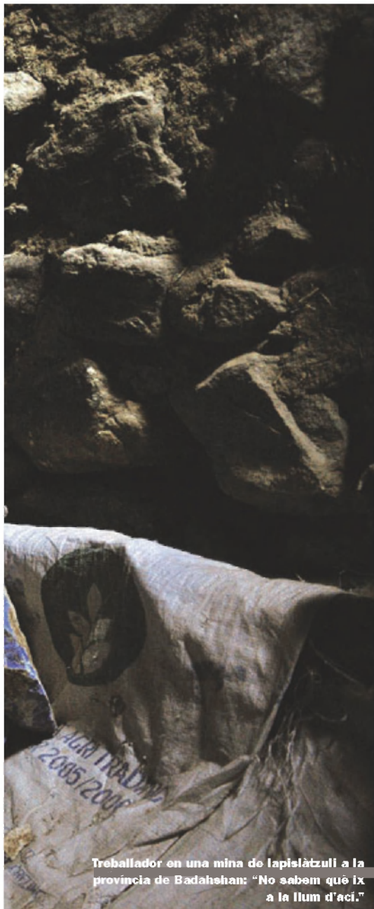
Treballador en una mina de lapislàtzuli a la província de Badahehan: "No sabem què ix a la llum d'ací."