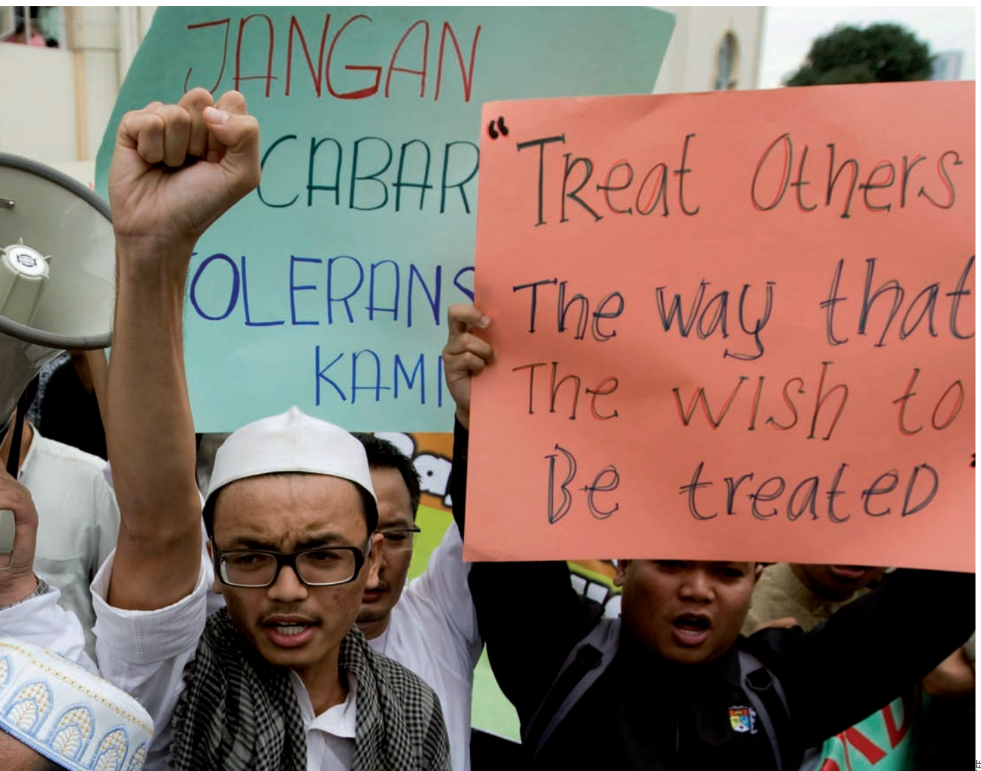
de gener, contra la sentència del tribunal de Kuala Lumpur que havia autoritzat als cristians l'ús del mot Al·là .

vigília de Nadal, un home de religió cristiana va ser mort davant de casa seva a Mossul, a l'Iraq, un país on es calcula que almenys han mort 2.000 cristians d'ençà de la intervenció dels Estats Units per enderrocar el règim de Saddam Hussein, ara fa gairebé set anys. La presència de cristians –que es calcula que és d'uns 700.000 practicants, menys d'un 3% del total de la població–, s'ha reduït considerablement a conseqüència de l'èxode que ha motivat la guerra. Aquestes darreres setmanes, a més, hi ha hagut un augment dels atacs contra els cristians iraquians, sobretot contra esglésies i convents, de resultes dels quals s'han mort diverses persones. Segons Louis Sako, arquebisbe de Kirkuk, la principal ciutat del nord del país, la violència respon a una campanya de neteja ètnica contra els cristians, de