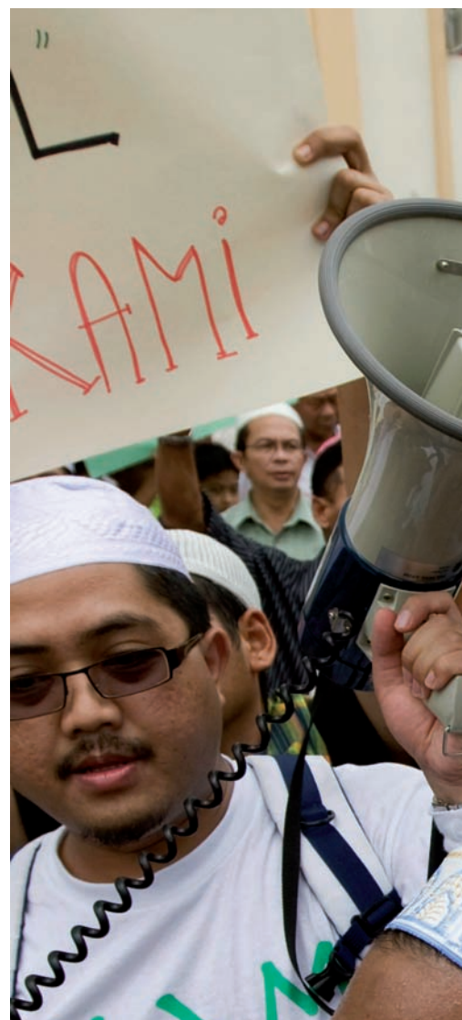
Els musulmans de Malàisia protesten, el dia 8

Discriminació i assetjament. Els coptes que viuen a Egipte, un 10% dels 80 milions d'habitants del país, denuncien des de fa temps una campanya d'assetjament. En concret, es queixen que són discriminats a l'àmbit laboral, que les autoritats els imposen restriccions a l'hora de construir noves esglésies i que l'actual llei electoral beneficia els partits islamistes i impedeix als coptes d'augmentar la seva representació a les institucions. Al seu torn, els musulmans,