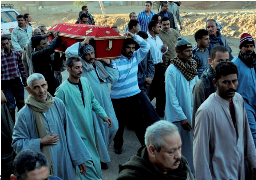
Un grup de coptes porten el cos d'una dona que s'havia mort arran dels enfrontaments entre les comunitats cristiana i musulmana de la localitat de Bahgur, a Egipte, el 9 de gener propassat.