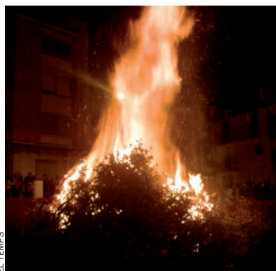
Foguera de Sant Antoni.

Els focs ens retornen la nació, dibuixen les seues fites. Diversos, però sempre sagrats, sacramentals. Des de la foguera comunal, piramidal, a petits foguerons a cada carrer; des d'un eix central – axis mundi –, el maig , a muntons de brosta, de les pires gegantines a