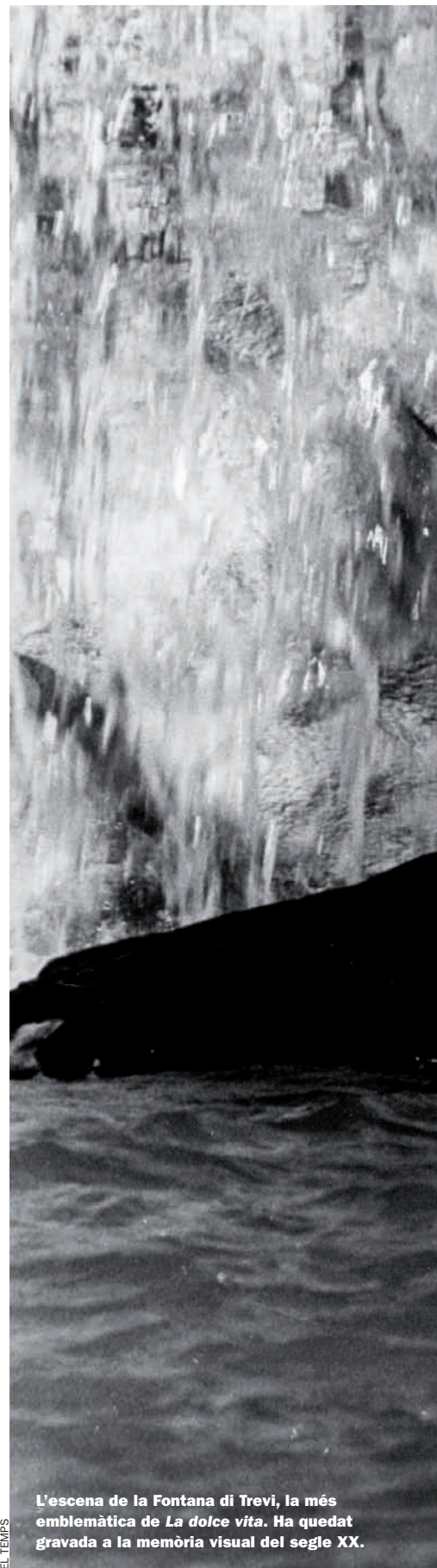
L'escena de la Fontana di Trevi, la més emblemàtica de La dolce vita . Ha quedat gravada a la memòria visual del segle XX.

És el film en què Fellini descobreix la filmació a l'estudi. A més de poder decidir fins al darrer detall els elements escenogràfics, la seva expressivitat artística quedarà reforçada, potenciada. La direcció d'actors mi-