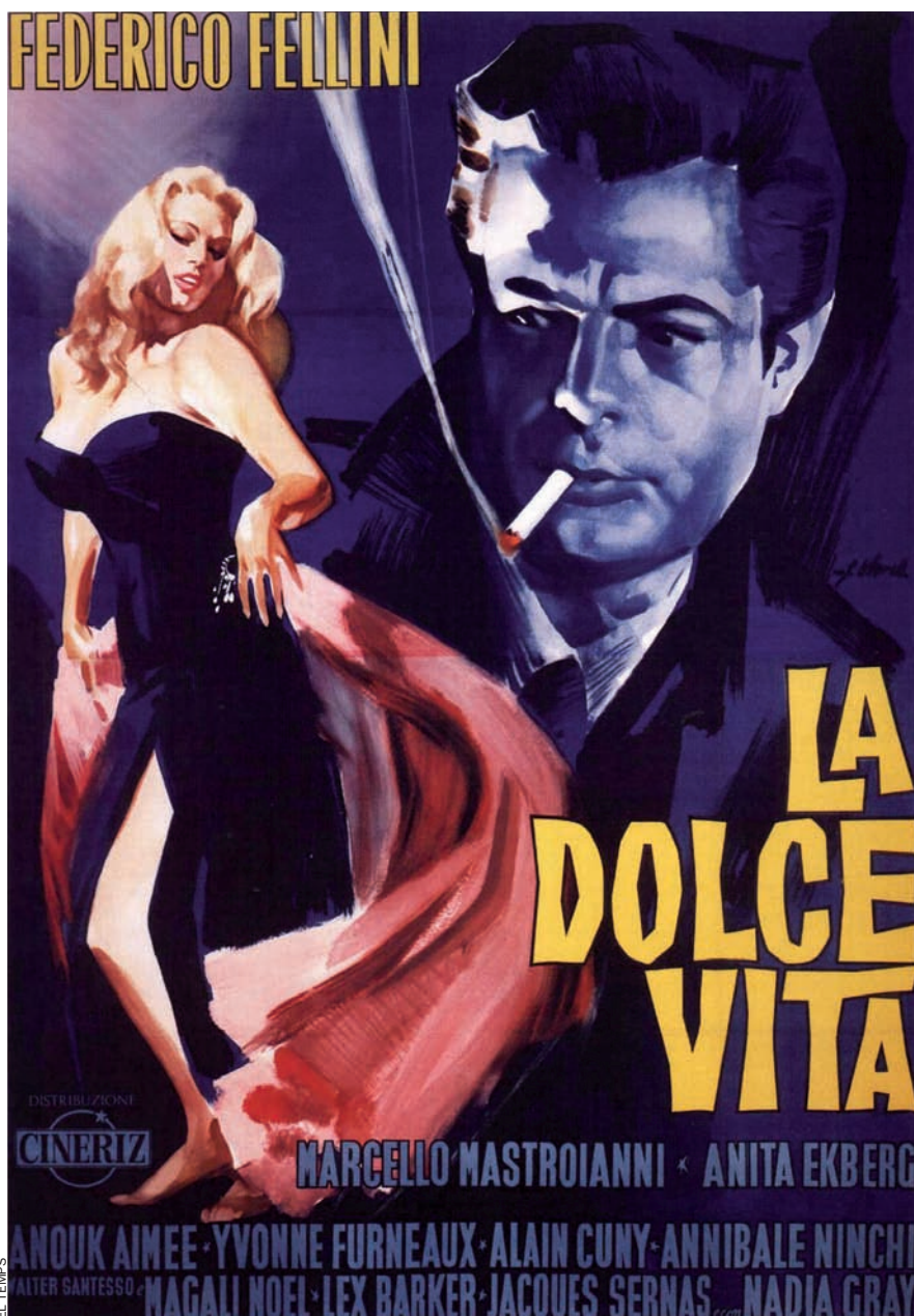
Cartell del film. Marcello Mastroianni es va convertir en una estrella del cinema internacional, i el col·laborador més estimat de Fellini.

■ Pier Palolo Pasolini, assessor Pier Paolo Pasolini, llavors narrador i poeta, va ser un dels assessors i col·laboradors de Fellini que no figuren als crèdits. Ja l'havia ajudat a buscar escenaris naturals per a Les nits de la Cabiria . Quan Fellini començava a pensar en el film va ser un dels escriptors amb qui feia recorreguts amb el seu cotxe, per Roma i per la platja, per contrastar, tot xerrant, les seves idees germinals sobre el film.