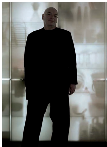
La peculiar trama urbana dels Poblat Marítims quedaria partida en dos per l’avinguda de Blasco Ibáñez. Arquitectes de la talla d’Oriol Bohigas i de Jean Nouvel s’hi han mostrat contraris.