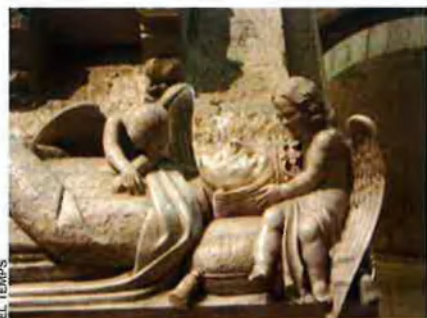
Martí l'Humà és criticat per Pere Tomich, per no haver designat hereu a la Corona d'Aragó.