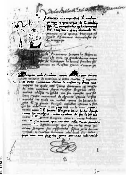
El manuscrit més antic, de la segona meitat del segle XV, és a la Universitat de Salamanca.

mences a les seves propietats. L'any 1430 va rebre de Pere Vilar, remença seu, uns béns en herència per tal que, "per pietat i amor de Déu, li fes gràcia dels mals usos".