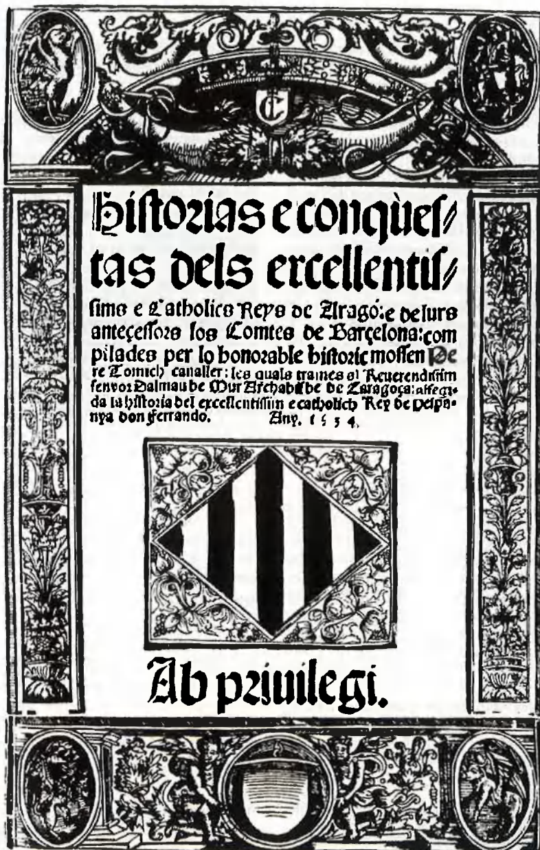
Portada de l'edició del 1534 de les Històries e conquistes del realme d'Aragó e principat de Catalunya , de Pere Tomich, llibre imprès a Barcelona. És a la Biblioteca de Catalunya.

un coneixement important de la tradició historiogràfica escrita en català, occità o llatí.