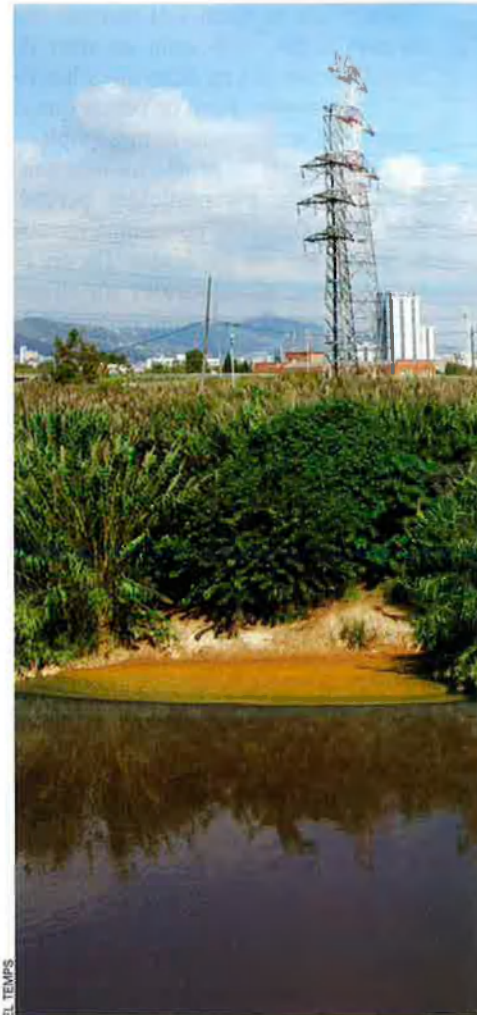
L'estudi de l'ICRA detecta una relació de causa

Els resultats de l'estudi "Bridging levels of pharmaceuticals in river wat-