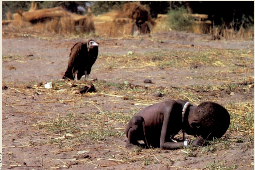
Mentre a Àsia la bonança econòmica ha permès de rescatar milions de persones de la pobresa, a l'Àfrica tot continua igual.

Lisboa, tan lluny. Tanmateix, els Objectius del Mil·lenni no són l'única pla a mitjà termini que s'ha revelat ineficaç amb el pas del temps. El taló d'Aquil·les de la Unió Europea és l'Agenda de Lisboa. Fou pactada pels caps de govern de la UE-15 en