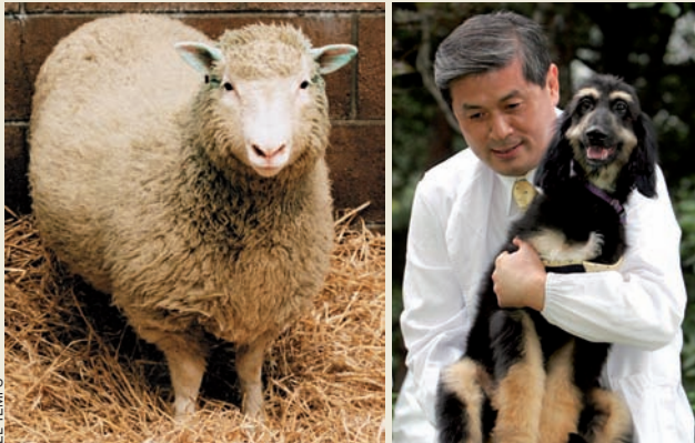
EL TEMPS El cas de Dolly va suscitar grans expectatives al món de la ciència.

Només un sud-coreà, Hwang Woo-Suk, va pretendre, el 2005, haver aconseguit cèl·lules mare a partir d'embrions clonats. Però el van enxampar i el cas passarà a la història com el frau científic més important de la dècada –seria avançar esdeveniments afirmar que serà el frau d'un segle tan prometedor. Quan les revistes científiques més prestigioses del món ja havien donat per bona la feina de Woo-Suk, científics de la Universitat de Seül –la confiança fa fàstic– el van llançar de la glòria al fang: els col·legues coreans van cercar les cèl·lules mare que coincidiren amb l'ADN dels donants (la prova inequívoca que Woo-Suk les havia clonades) i no les van trobar enlloc. Diu la BBC que Woo-Suk continua, en un laboratori de Corea, provant de clonar animals. Quins?