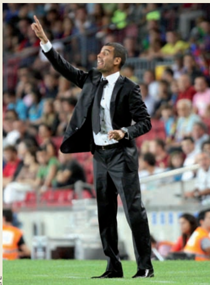
Pep Guardiola ha estat, contra tots els pronòstics, la revelació al món del futbol.

Un any i mig més tard, però, tot és de color de rosa, com la samarreta amb què el FC Barcelona ha aconseguit d'aixecar, als Emirats Àrabs, l'única copa que li faltava al museu, la que ha completat un sextet inèdit a la història del futbol. Tot-hom hi ha caigut rendit: sense escridassar gaire, assenyat com és, fins i tot s'ha revelat un gran psicòleg i és considerat un model, en tots els sentits de la paraula. Serà Guardiola mateix, que decidirà la llargària del seu periple com a entrenador culer. I potser no serà gaire extens, perquè el viu amb intensitat enorme. Tanta, que l'altre dia no va poder evitar de plorar en públic.