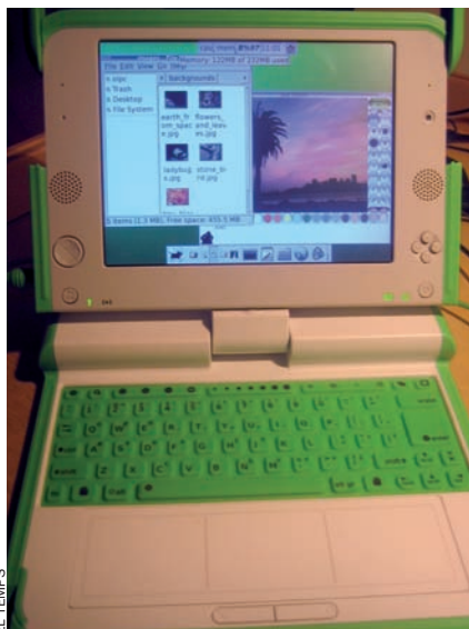
EL TEMPS Les expectatives creades pel ordinadors de baix cost OLPC no s'han complert.

Prensa a banda, el final de decenni ens deixa una bona rastellera de grans llançaments que han acabat essent un bluf. Entre els més destacables en aquest sentit hi ha l'OLPC, un projecte llançat pel guru Nicholas Negroponte el 2005, que pretenia estendre l'alfabetització digital posant en venda ordinadors portàtils amb sistema operatiu Linux a xiquets de tot el món pel preu de 100 dòlars. Les sigles de l'invent procedeixen de l'expressió "one laptop per child" ('un ordinador per xiquet') i tenia per objectiu primordial els infants del tercer món. Per tal de finançar la distribució dels aparells entre aquests, es va idear un sistema que es va batejar amb el nom de G1G1 ("get one, give one", és a dir, 'compra'n un i dona'n un altre'), a través del qual s'emplaçava els xiquets del primer món a comprar un ordinador pel preu de 199,5 dòlars, en canvi que el consorci impulsor de