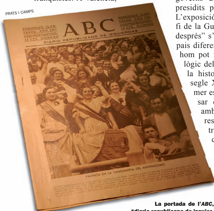
La portada de l'ABC, "diario republicano de izquierdas", mostrava les falleres amb el puny alçat en una coreguda benèfica a favor de la República, l'1 de setembre del 1936.