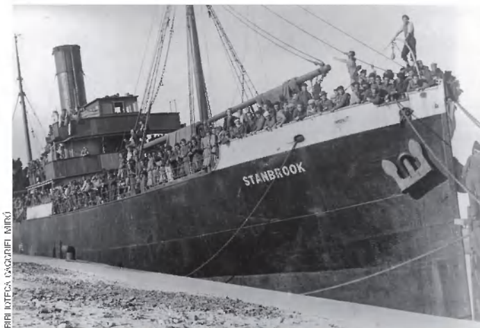
BIRI IUSTEFA / GAZETELI MURKO