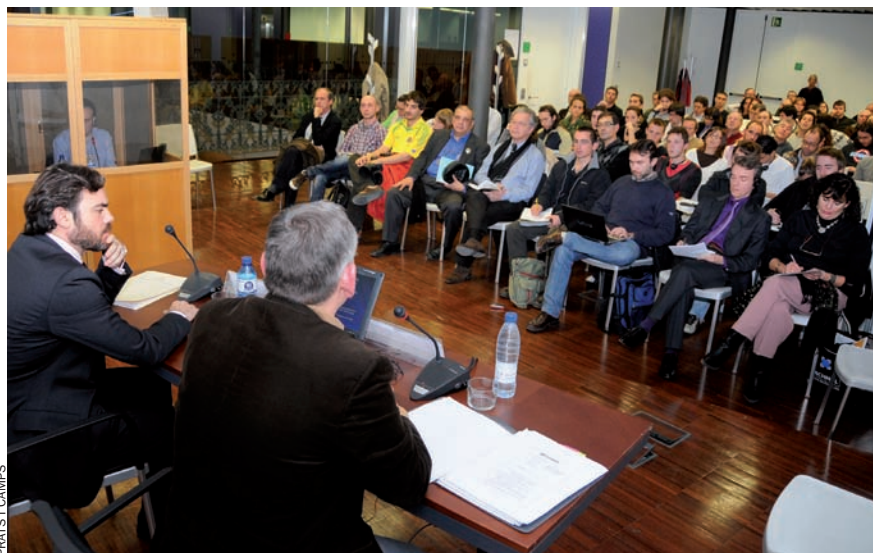
Un moment del seminari organitzat per l'Institut Ignasi Villalonga d'Economia i Empresa.

el primer intent de crear-ne una –si bé una mica sui generis – data del 1946, quan va nàixer Gran València, un projecte d'àmbit supramunicipal amb un plantejament interessant però que, a la pràctica, no va tenir cap transcendència. Ja a l'etapa democràtica, Ajuntament de València i Generalitat es posaren d'acord per crear el Consell Metropolità de l'Horta, del qual s'esperava fins i tot que aportara un cert ordre urbanístic en el creixement de la conurbació de València. Es tractava de posar una mica de seny per no repetir les pautes de creixement que s'havien seguit els anys de més intensa recepció de l'allau migratòria. El Consell Metropolità, però, mai no arribà a reeixir a l'etapa dels socialistes i començà a precipitar-se cap a la inanició quan el Partit Popular accedí a l'ajuntament. La majoria dels ajuntaments de l'Horta formaven aleshores un cinturó roig, amb què difícilment un govern municipal del PP teòricament superior podia posar-se d'acord. El Consell Metropolità de l'Horta es desmantellà el 2000 i, d'aleshores ençà, els únics lligams que existeixen són tres organismes que gestionen transports, residus i subministrament d'aigua.