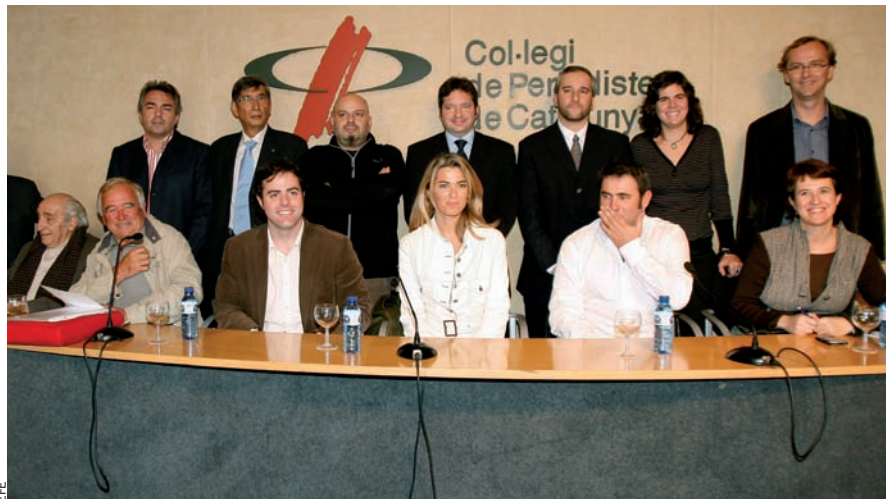
Presentació del manifest de suport a les consultes independentistes, el dia 26 novembre, al Col·legi de Periodistes de Catalunya.

A la jornada d'aquest diumenge, per comarques, la d'Osona és on es faran més consultes, amb 35 municipis, que representa més del 90% de la població. Entre aquests municipis, hi ha les principals poblacions de la comarca, com ara la capital, Vic, o Manlleu, Torelló i Centelles. De fet, per l'alt suport que ha rebut aquesta convocatòria, Osona serà un dels principals punts que caldrà