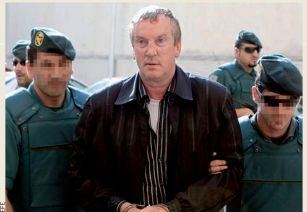
La Guàrdia Civil en una operació a Palma contra el crim organitzat d'origen rus.

A principi d'aquesta legislatura autonòmica el govern es va prendre la creació de la policia com un objectiu a complir en els quatre anys de mandat. Hom volia un cos policíac no subsidiari dels cossos estatals. Però les reticències del govern de Zapatero, i més concretament del ministre espanyol d'Interior, Alfredo Pérez Rubalcaba, han anat esvaint la possibilitat. El juny del 2008, Rubalcaba refredava molt les aspiracions de les Balears (i de totes les altres comunitats que aspiren a tenir policia pròpia). Rubalcaba va dir que l'estat no finançaria aquests nous cossos. El govern balear confiava cegament en aquest finançament, perquè no té recursos propis. Menys encara ara mateix, quan la crisi ha fet caure les recaptacions –en impostos, taxes, etc.– de prop de 1.000 milions d'euros enguany –sobre un pressupost de 3.500. Enmig d'aquesta situació d'emergència econòmica és inviable a curt termini de pensar en la policia autonòmica sufragada amb recursos propis. I com que l'estat no en dóna, doncs el resultat és que la possibilitat de veure uniformats autonòmics pels carrers de les Balears s'ajorna sine die .