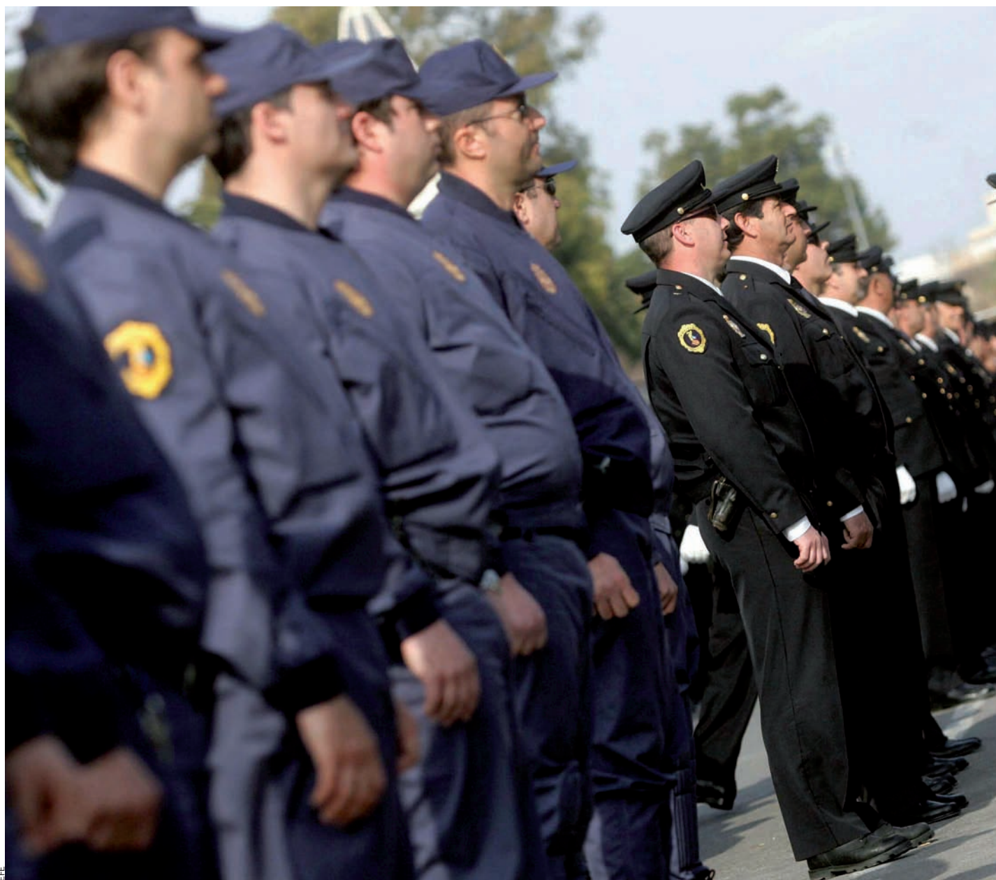
Acte de celebració del quinè aniversari de l'actual policia autonòmica valenciana, adscrita a la policia nacional espanyola.