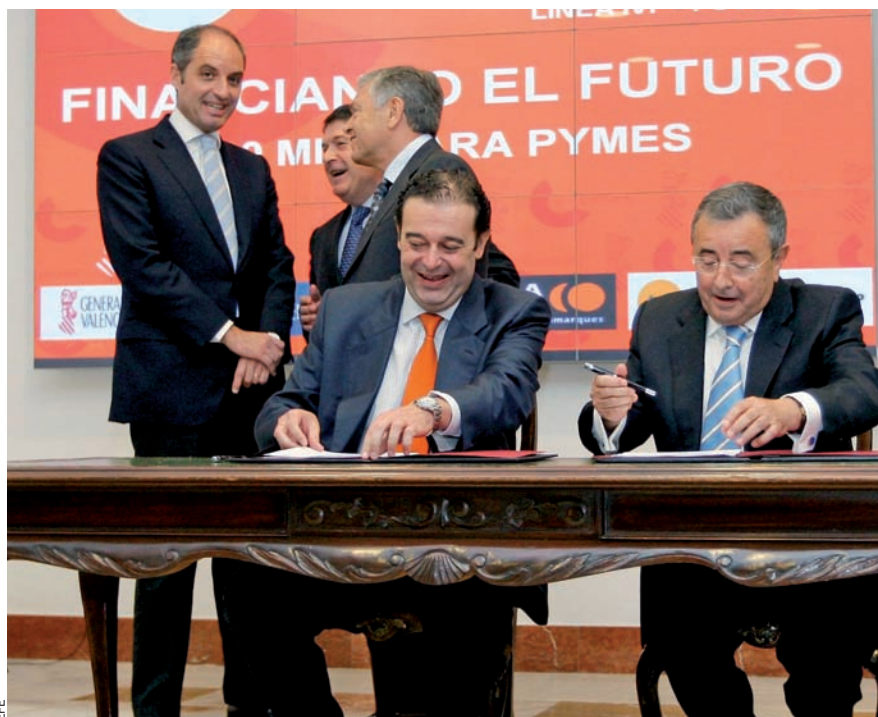
Francisco Camps, José Luís Olivas—president de Bancaixa— i Modesto Crespo—de la CAM— conversen en presència de Gerardo Camps i Rafael Soriano—president de Caixa Ontinyent.