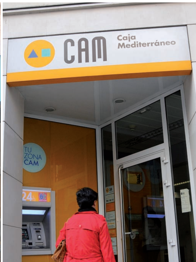
Dues oficines de Bancaja i CAM a València.

Les caixes valencianes no resten al marge del procés de concentració financera. La Generalitat Valenciana s'ha decidit a impulsar la fusió entre CAM i Bancaja, a fi d'evitar una absorció d'una de les dues per part de Caja Madrid. Però per atènyer aquesta fusió històrica, abans caldrà superar les resistències que encara es manifesten des d'Alacant.