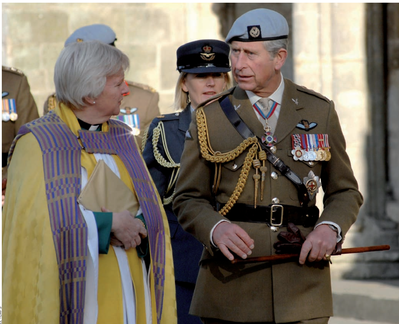
EL TEMPS El príncep Carles d'Anglaterra assisteix amb uniforme militar a una celebració a la catedral de Salisbury, al Regne Unit, el desembre del 2007.

La visita del príncep Carles d'Anglaterra al Quebec ha causat indignació entre els sobiranistes, que acusen la monarquia britànica de genocidi cultural. Algunes entitats independentistes han preparat actes de protesta per rebre el futur cap d'estat del Canadà.