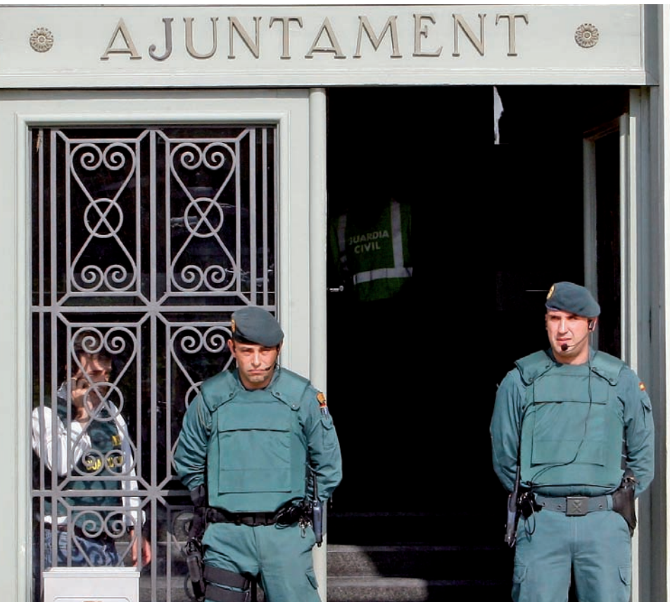
Agents de la Guàrdia Civil custodien l'accés a l'Ajuntament de Santa Coloma de Gramenet, durant l'escorcoll ordenat pel jutge Baltasar Garzón.

L'operació Pretòria', impulsada pel jutge estrella de l'Audiència Nacional espanyola per una presumpta trama de corrupció urbanística, ha sacsejat de cap a cap el panorama polític català i ha palesat la descoordinació i la incapacitat dels organismes de control de la gestió pública.