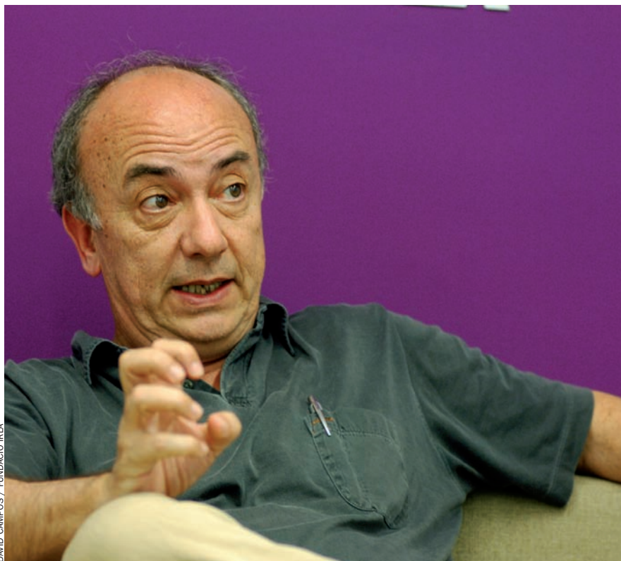
DAVID CAMPOS / FUNDACIÓ IRLA

ment deshonestos. Hi ha de tot, com a tot arreu. El problema no és la classe política en si.