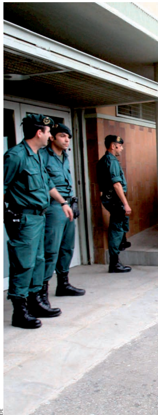
Agents de la Guàrdia Civil espanyola custodien

Aquesta llei (2007) preveu que el finançament dels partits serà públic —mitjançant subvencions, d'acord amb els resultats electorals— i privat. En aquest darrer cas ha de provenir de militants i simpatitzants, de la gestió del patrimoni del partit, de la comercialització de productes simbòlics —samarretes, objectes de propaganda, etc.— i coses semblants. A més, preveu que si les aportacions són d'entitats jurídiques —és a dir, empreses— no poden provenir de companyies ni organismes públics, ni tampoc de cap empresa que hagi tingut un contracte directe o indirecte amb l'administració. També es prohibeix allò que se'n diu operacions assimilades , és a dir, que un partit polític faci un encàrrec a una empresa i la factura la pagui un tercer.