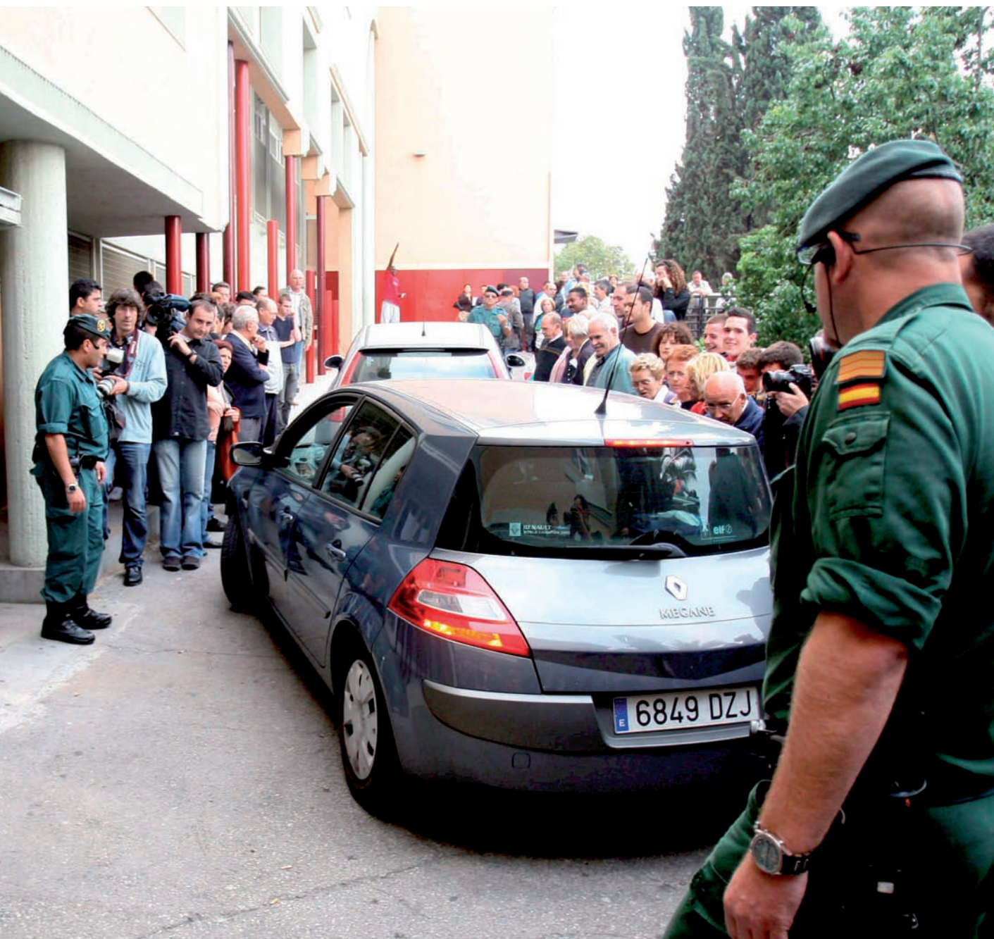
l'entrada de l'Ajuntament de Santa Coloma de Gramenet (Barcelonès), durant l'escorcoll que s'hi dugué a terme la setmana passada.

que s'hi vegi gaire voluntat d'acabar la corrupció. Val a dir que ERC i ICV han demanat fa poc una reforma d'aquesta llei perquè “hi ha partits que pensen que feta la llei, feta la trampa”.