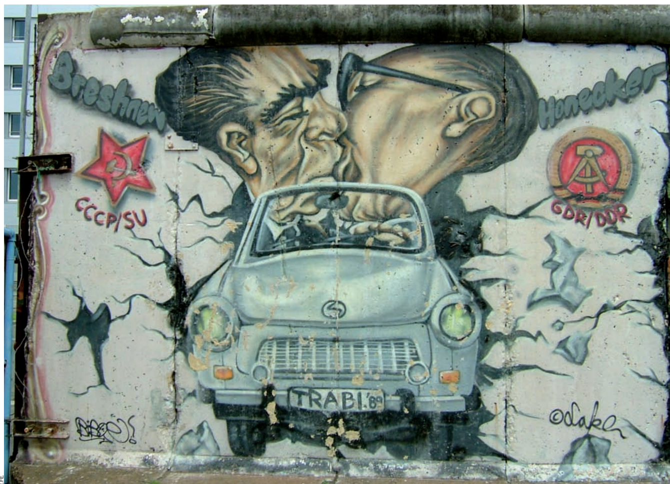
Caricatura del petó entre Leonid Brejnev, líder de l'URSS, i Erich Honecker, líder de la RDA, al mur de Berlín.