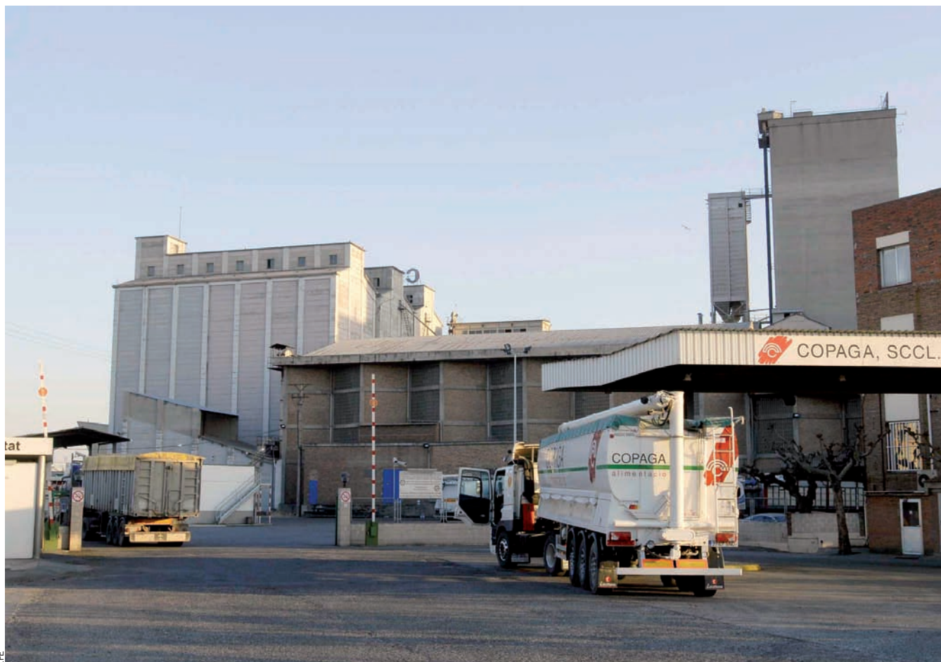
Les comarques de Ponent tenen un creixement més positiu que la resta del país per l'impuls del sector de serveis i un impacte menor de la construcció.