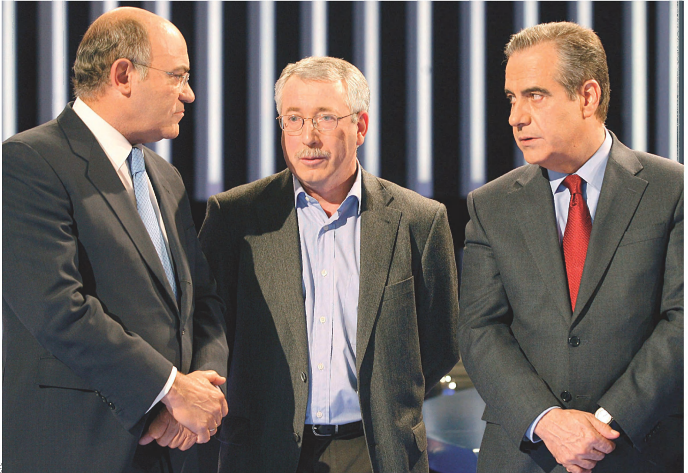
El president de la CEOE, Gerardo Díaz Ferrán; el secretari general de CC00, Ignacio Fernández Toxo; i el ministre de Treball, Celestino Corbacho.