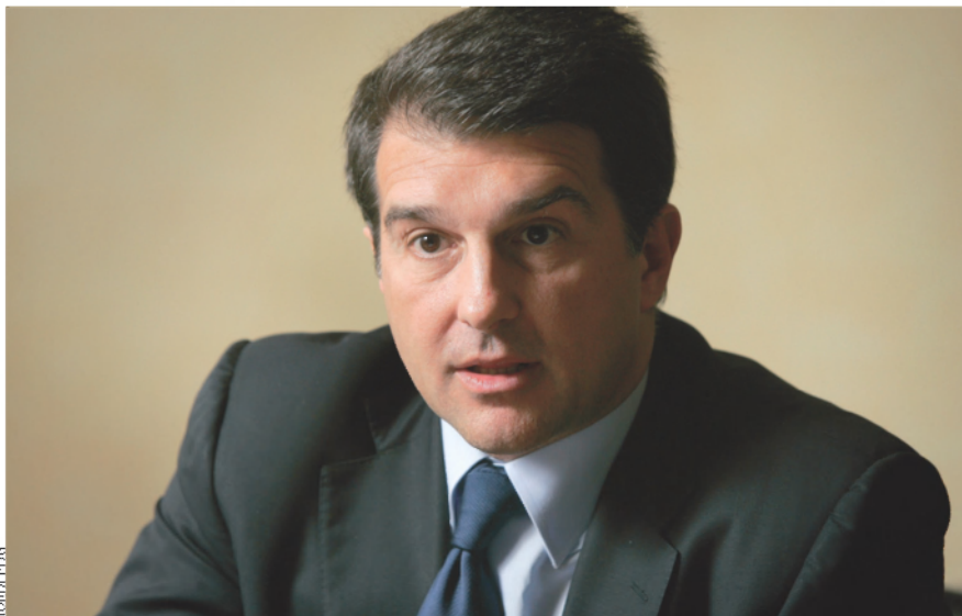
A dalt, el president del FC Barcelona, Joan Laporta; a baix, les adhesions de l'entitat esportiva i de l'agrupació de veterans a la ILP per una "Televisió sense fronteres".

La iniciativa legislativa popular per una "Televisió sense fronteres" continua aplegant suports: la implicació del FC Barcelona, des del president, Joan Laporta, fins als veterans o les penyes, és un exemple de l'extensió social de la iniciativa.