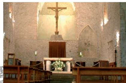
Altar de Sant Miquel de Cuixà.

La mil·lenària pedra, sobre la qual encara se santifica pa i vi, permanent enfront d'una natura variable, continuadora del vell culte a les sagrades roques, perquè hom les considera amb poder fecundador i contenidores dels esperits