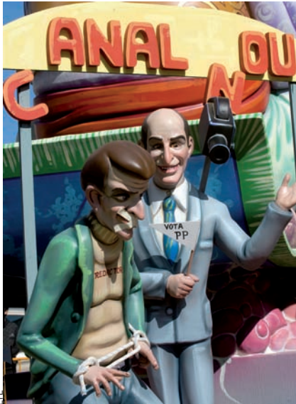
Una imatge de les falles de València referida al control informatiu del PP sobre Canal 9.

1.314 voltes. Un canvi de signe que també es complementava amb l'anorreament de l'oposició: eludida o divulgada negativament, actua de titella en uns teletenotícies elaborats absolutament a mida del govern valencià.