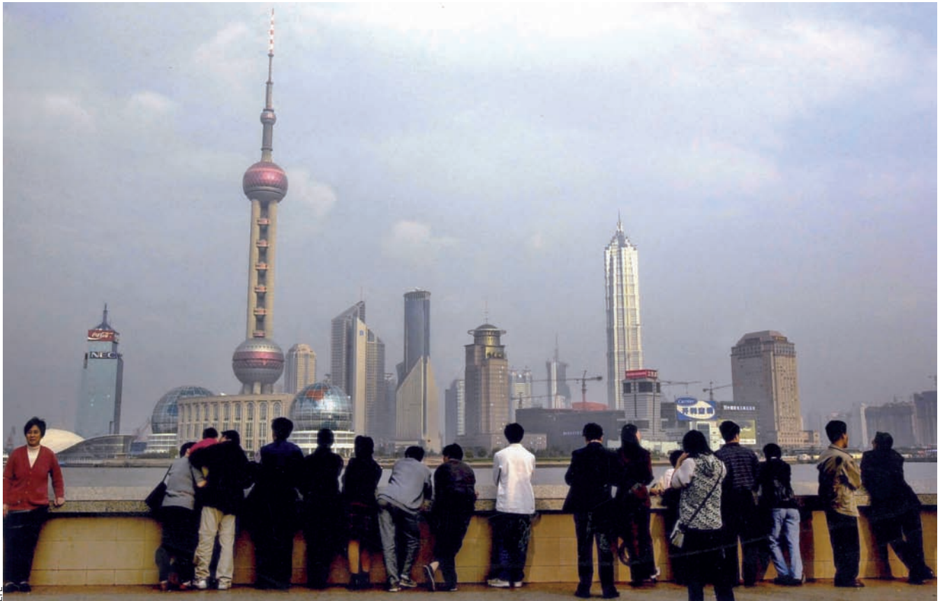
Xangai s'ha convertit en la gran capital dels negocis i en un punt d'atracció per a grans companyies.

altres països i sistemes polítics úniques al món, que expliquen en bona mesura la seua perpetuació en el poder. Passar per alt que la societat civil, com més madurarà més reclamarà la salvaguarda dels drets humans, sembla del tot forassenyat, encara més quan apareixen símptomes de cansament vers l'estat que indiquen un canvi progressiu en l' statu quo . L'episodi ocorregut el 2007 a la ciutat de Xiamen –i l'efecte mimètic– n'és ben representatiu. Milers de conciutadans d'aquesta localitat costanera es manifestaren al carrer contra la construcció d'un planta química,