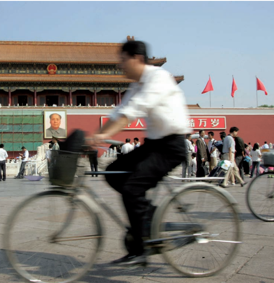
referència per als xinesos des del 1949.

el capitalisme, però sense renunciar obertament ni públicament al socialisme. De fet, encara s'hi pot detectar avui un fort intervencionisme estatal en l'economia, i les empreses controlades per l'estat hi tenen un paper preeminent. Amb tot, resulta difícil de catalogar l'economia xinesa com a socialista quan, per exemple, la major part de la producció es fa en condicions de sector privat i es comercialitza a preus lliures.