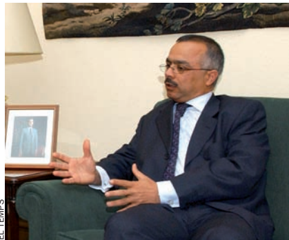
EL TEMPS El ministre d'Interior marroquí, Chakib Benmoussa

insisteixen: també els amazics han de tenir llibertat per a escollir una cosa tan personal com el nom que portarà el seu fill, per a tota la vida.