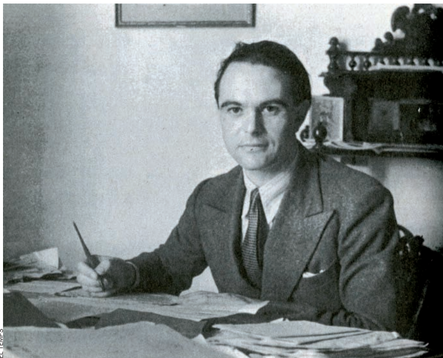
Alan Hillgarth (Londres, 1899 - Tipperary, Irlanda, 1978), cònsol britànic de Palma, va fer un paper clau en la guerra diplomàtica amb italians i alemanys, per l'ocupació de Menorca.

M enorca no va tenir cap paper destacat a la guerra civil. La República la va utilitzar com a plataforma per a reconquerir Mallorca, però la missió va fracassar. Bombardejada, i sotmesa a blocatge per l'acció conjunta de les forces navals i aèries franquistes, italianes i alemanyes, amb base a Mallorca, al final de la guerra es va haver de rendir sense oferir resistència.