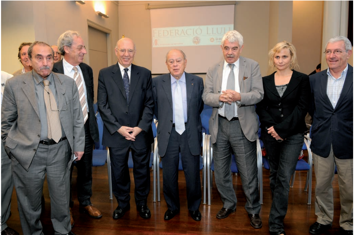
Presentació a Barcelona de la ILP, impulsada per ACPV, per a garantir la recepció de mitjans àudio-visuals en territoris amb llengua compartida.

Una trentena de personalitats del món polític, social i cultural del Principat es van aplegar a la seu d'Òmnium per expressar el suport a la recollida de signatures per a la iniciativa legislativa popular promoguda per ACPV. Cohesió territorial, unitat de la llengua i indústries àudio-visuals més potents: tres oportunitats que les falses fronteres imposades des de la política neguen a les comunitats lingüístiques no castellanes de l'estat espanyol.