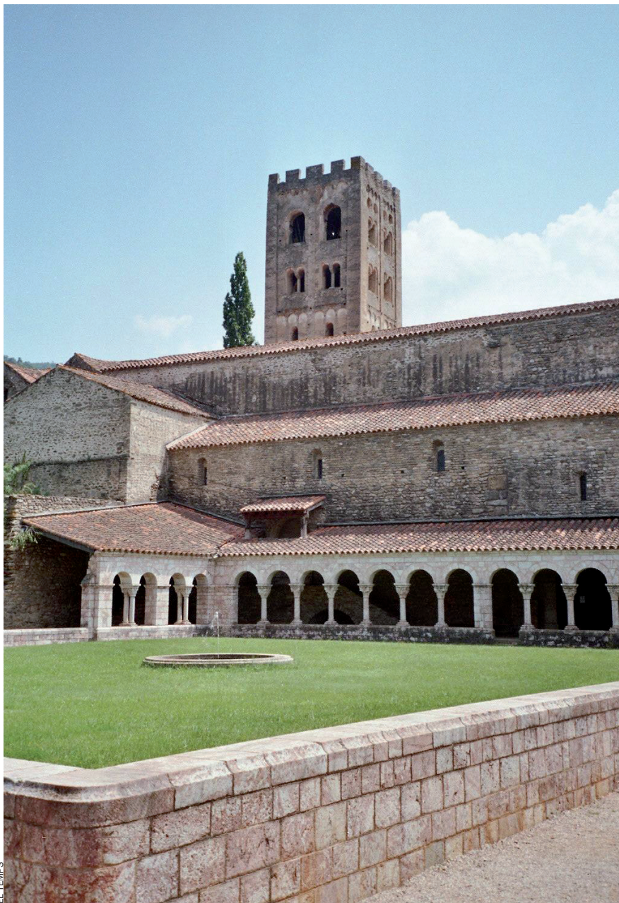
A dalt, el monestir de Sant Miquel de Cuixà. A baix, el de Montserrat. Es tracta de dos punts clau en la vida de l'abat Oliba, que ara són el centre de la ruta “Abat Oliba, fundador d'Europa”.

L'embolcall del patrimoni. La ruta “Abat Oliba, fundador d'Europa” es complementarà amb diverses accions impulsades des del sector públic per aportar més qualitat a l'oferta turística. Es preveu d'adequar físicament els monestirs de Ripoll, Sant Joan de les Abadesses i Cuixà, per tal de garantir-ne l'accessibilitat a persones amb mobilitat reduïda. Segons el projecte que han presentat els impulsors, també és previst d'estudiar la restauració de la col·lecció i la biblioteca de Sant Miquel de Cuixà, a més de fer una recreació en 3 dimensions del monestir a l'època de màxima esplendor, per tal de millorar