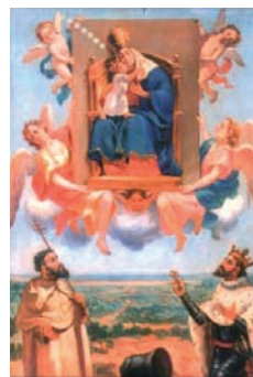
Mare de Déu del Puig.

es disposa a descansar. Les llegendes de la troballa de les nostres morenetes son insistent: les autoritats, des d'un entorn aspre i intricat, volen portar-les a poblat civilitzat i canònica parrò-