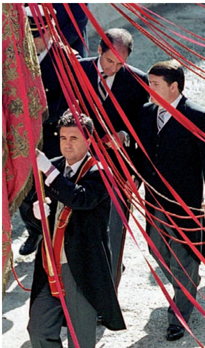
Els dos ambaixadors del País Valencià nomenats per Eduardo Zaplana i Francisco Camps ja no exerceixen com a tals: la carrera diplomàtica de Julio Iglesias i Jaume Matas va ser ben curta. L'un, va embutxacar-se sis milions d'euros en canvi de sis concerts; a l'altre, van agrair-li l'aprovació del PHN.

La Generalitat Valenciana limita la seua projecció exterior al suport a l'exportació que ofereixen les oficines de l'Ivex, un organisme que va fer-se famós en contractar com a “ambaixador de la Comunitat Valenciana” el cantant Julio Iglesias pel triple d'allò que constava al contracte.