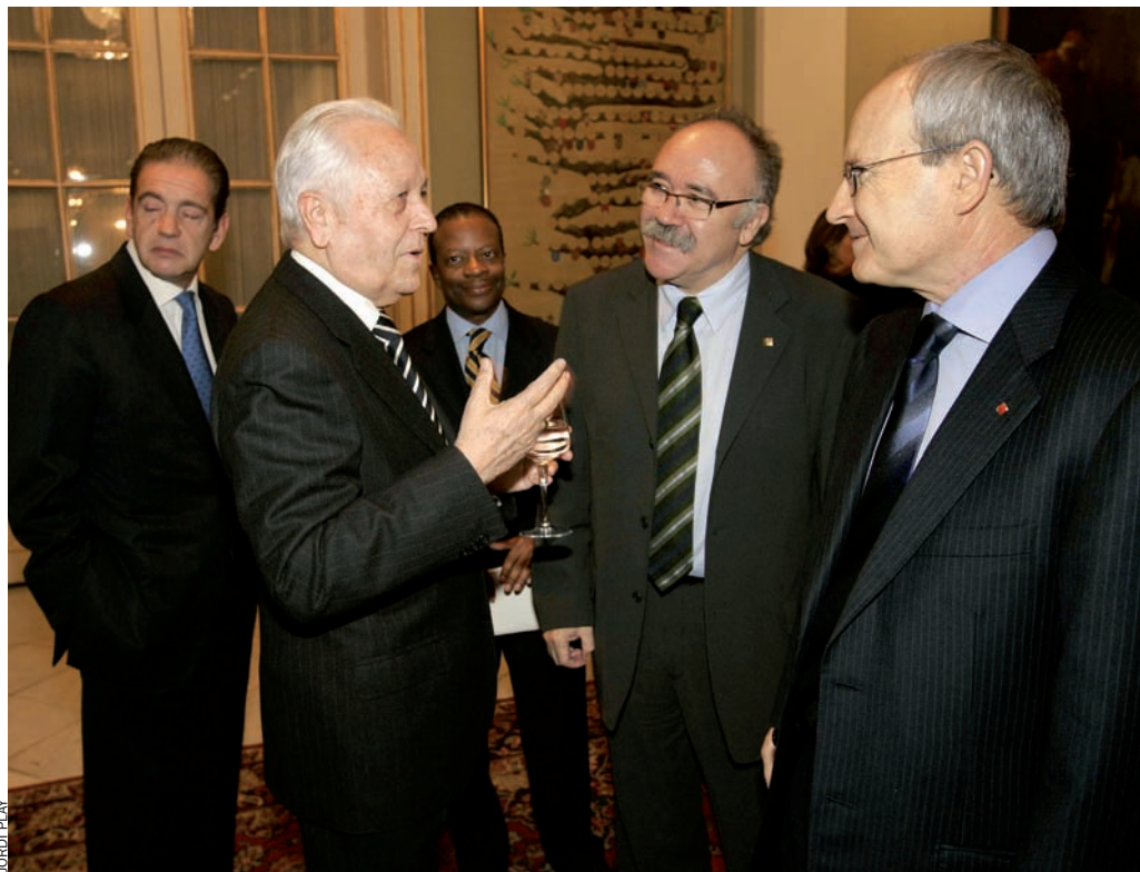
El president i el vice-president de la Generalitat de Catalunya, José Montilla i Josep-Lluís Carod-Rovira, reben els cònsols de la ciutat de Barcelona, el gener de l'any passat.

En el desenvolupament de l'activitat competencial, tots els departaments de la Generalitat de Catalunya, a mesura que s'ha anat avançant en una estructura de relacions internacionals globals, han acabat fent polítiques que han sobrepassat les estrictes fronteres autonòmiques i de l'estat espanyol, a través de convenis de col·laboració, programes conjunts o més fórmules