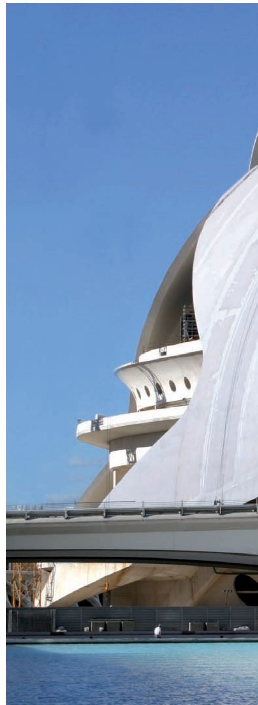
El Palau de les Arts Reina Sofia requereix una

A pocs quilòmetres de Mundo Ilusión es va enllestint la construcció de l'aeroport de Castelló. La instal·lació serà de gestió privada, però el contracte de concessió conté un article segons el qual l'administració pagarà sis euros per cada passatger de menys que no utilitze la infraestructura, prenent com a base una previsió de 600.000 passat-