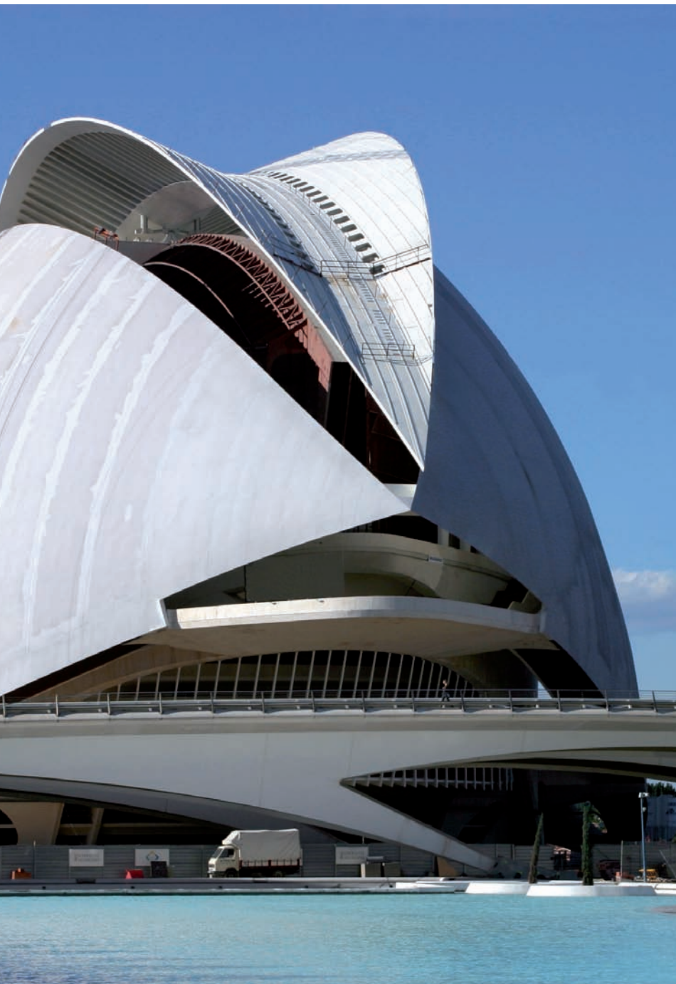
inversió anual de quatre milions d'euros en manteniment.

aquest sentit, la Ciutat de les Arts i les Ciències va marcar un precedent pel que fa a la disbauxa econòmica amb què s'han gestionat posteriorment més grans fites. El complex construït per Calatrava tenia un cost inicial de 200 milions d'euros, si bé actualment ja arriba a 1.300 milions. I encara cal afegir-hi el cost de manteniment de tot el recinte. Només el Palau Reina Sofia costa quatre milions d'euros cada any.