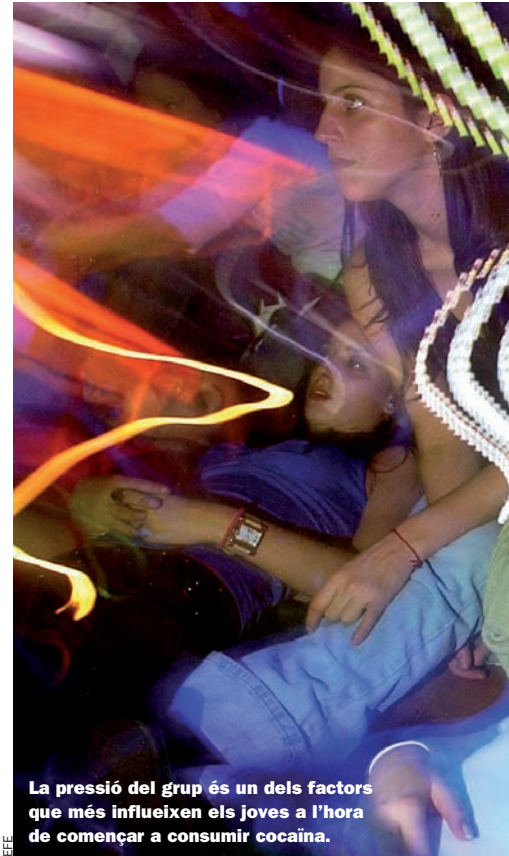
La pressió del grup és un dels factors que més influeixen els joves a l'hora de començar a consumir cocaïna.