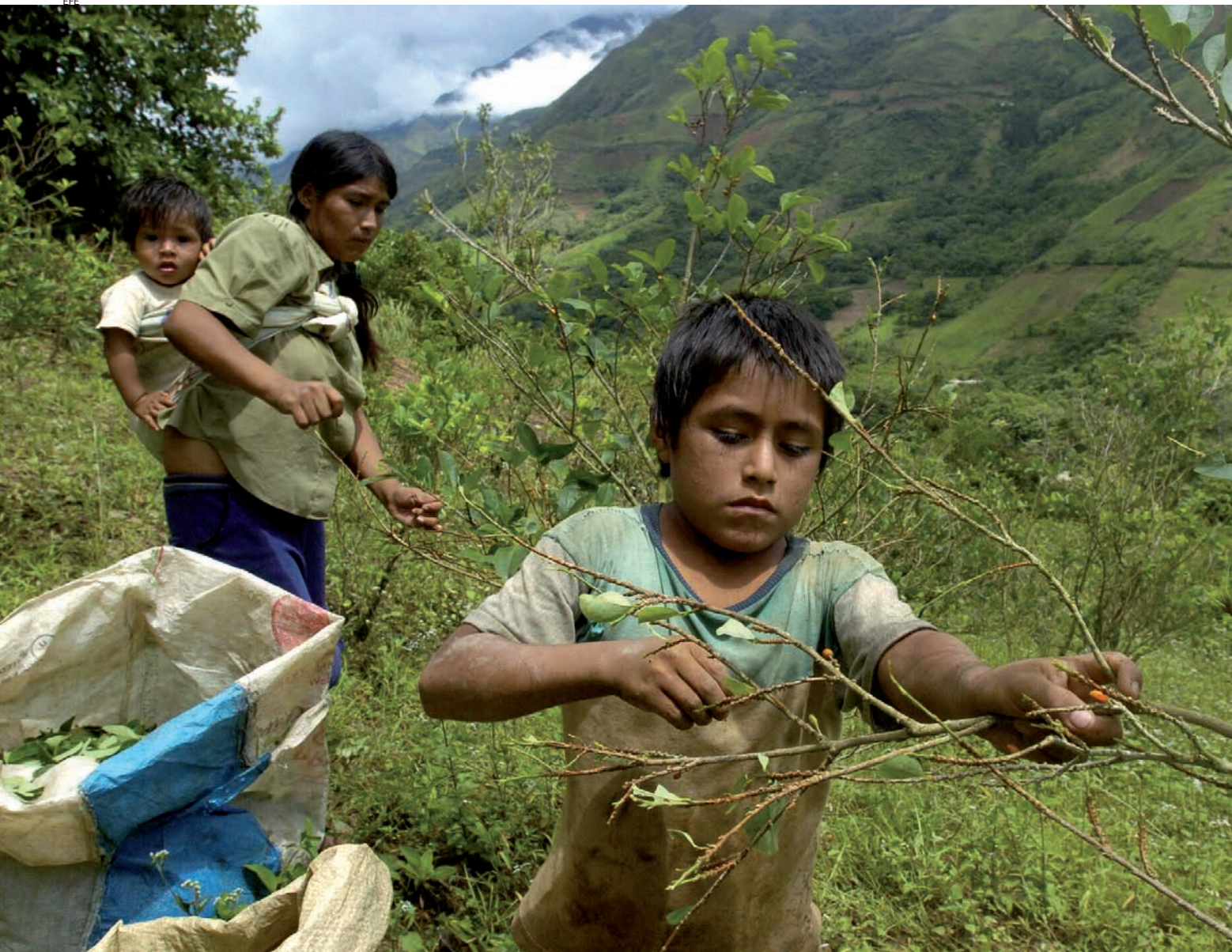
Dos nens de la comunitat de Santa Rosa, a la vall peruana de Monzón, recullen fulles de coca per ajudar les seves famílies.