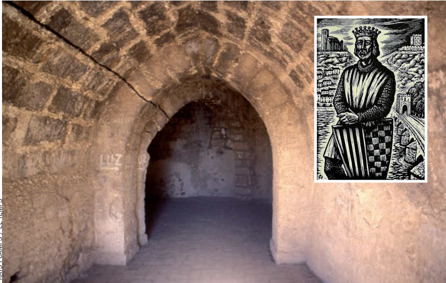
FRATIS I CAMPS / EL TEMPS