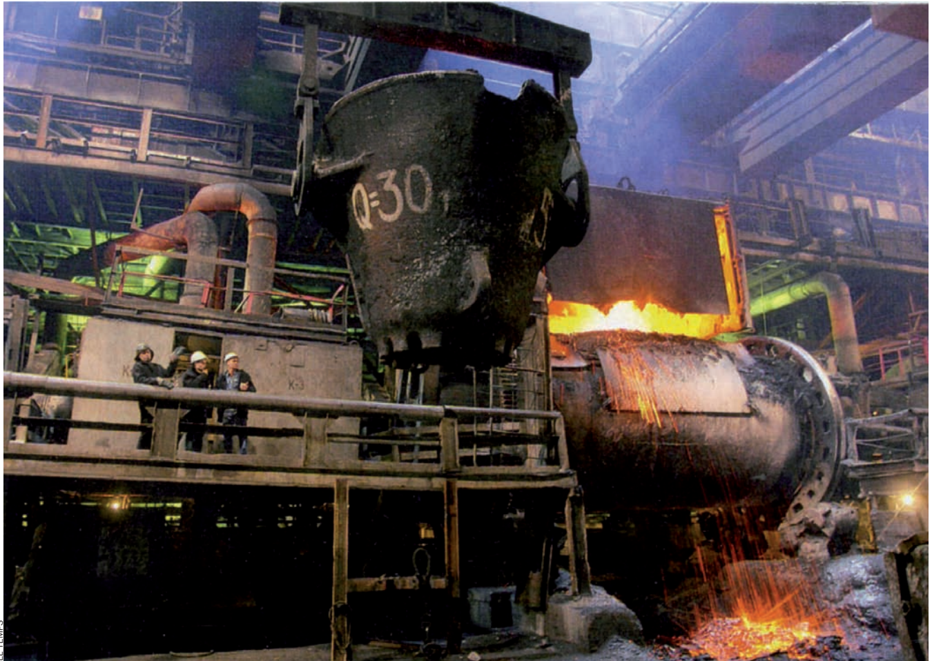
Fàbrica de níquel a la Norilsk siberiana: "Els empresaris no estan lliures de pecat."

els mercats s'enfonsaren: fa un any i mig va vendre la vostra part a Norilsk Nickel. Per això va rebre aproximadament set milers de milions de dòlars i a més una participació del catorze per cent en el gegant de l'alumini Rusal de Deripaska. Fou sort o destresa?