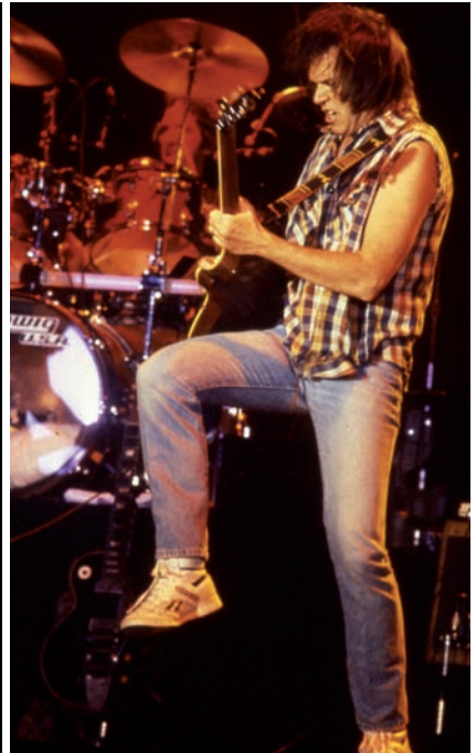
Tres guitares de tres mites: Bob Marley, a l'aeroport; Bruce Springsteen, i Neil Young, en plena acció.