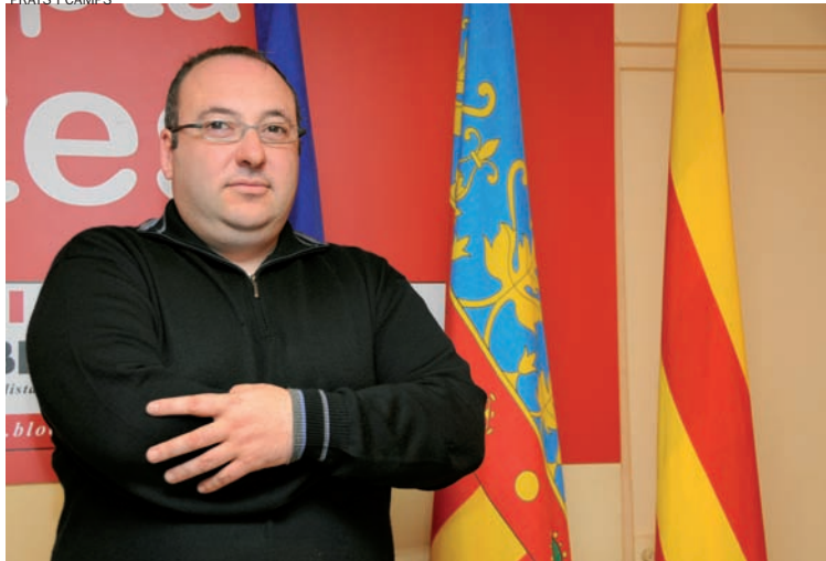
PRATS I CAMPS

El projecte hauria de ser, com els republicans van desitjar, el Compromís del