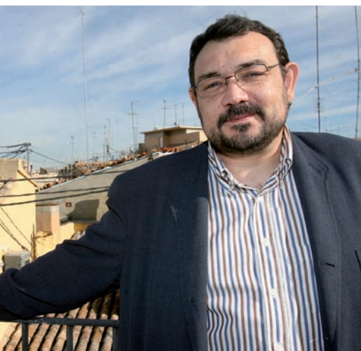
PRATS I CAMPS