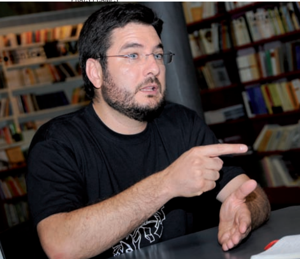
PRATS I CAMPS