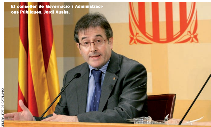
GENERALITAT DE CATALUNYA

Aquest augment de l'independen-tisme ha anat acompanyat de l'eclosió de plataformes polítiques i socials de tipologia diversa, que reivindiquen un estat propi per a Catalunya, juntament amb el sorgiment de sectors més reivindicatius, en matèria nacional, dins les formacions de tradició catalanista, com ara CDC, UDC i també Iniciativa. Fins i tot Esquerra ha viscut un convuls procés de crisi interna amb l'aparició de corrents crítics que consideren que l'estratègia de l'actual direcció ha abandonat l'objectiu de la independència. Fins al punt que un dels corrents, Reagrupament.cat, liderat per l'ex-conseller de Governació, Joan Carretero, ha acabat esdevenint l'embrió d'un projecte polític fora d'ERC. Per a Jordi Muñoz, polític i professor de la UPF, la falta de lideratges polítics clars pot explicar, en part, la proliferació de tantes plataformes de caràcter sobiranista amb objectius pràcticament compartits. Però, d'una altra banda, considera que no es pot afirmar que el descontentament amb