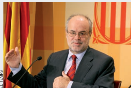
El conseller d'Economia català, Antoni Castells, anuncia un pla d'estalvi per al govern.

El govern català ha presentat un pla d'estalvi arran de les perspectives econòmiques negatives. El conjunt de mesures estalviarà 900 milions d'euros i consistirà, d'una banda, a reduir les despeses dels departaments, de manera proporcional al pressupost de cadascun i per un valor total de 850 milions. I, d'una altra, a no cobrir les vacants a l'administració. La conselleria que perd més pressupost és la d'Obres Públiques, inclosa la construcció de la futura línia 9 del metro, que rebrà 100 milions menys. Tanmateix, el conseller Antoni Castells assegura que això no