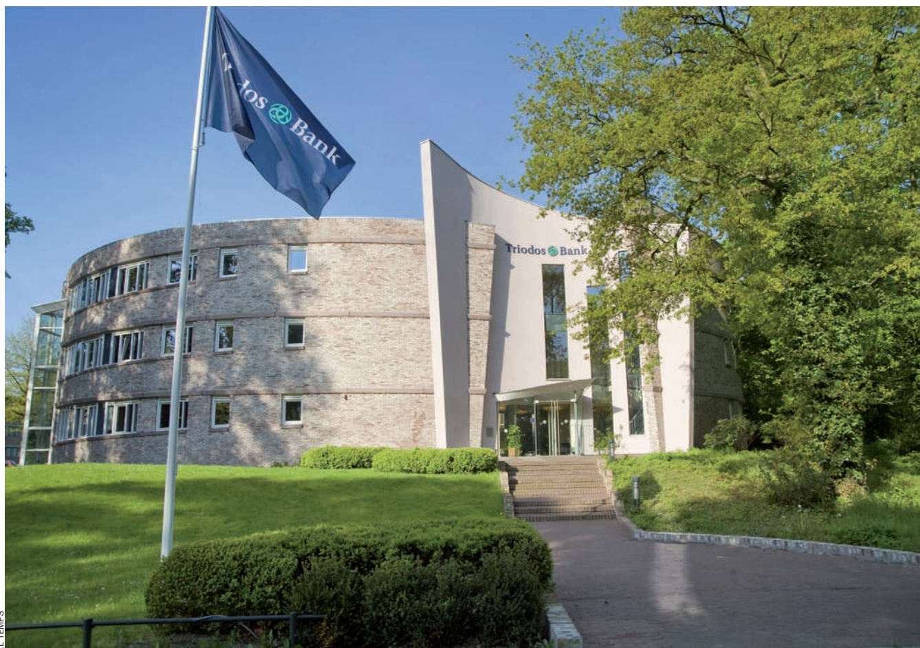
Seu central de Triodos Bank, a Utrecht (Països Baixos).