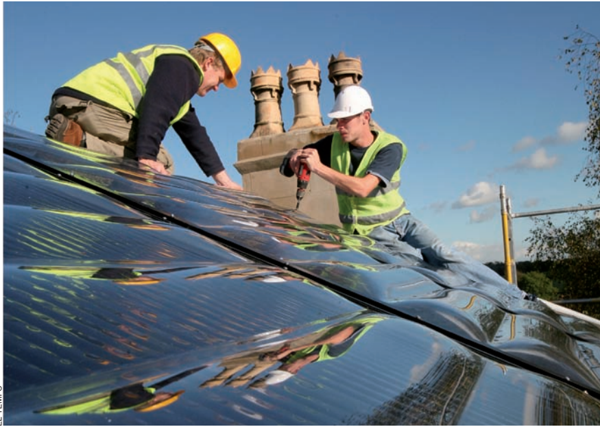
Les energies renovables són una de les prioritats de la banca ètica.

que ens demanen que parlem de la crisi perquè n'hi ha”.