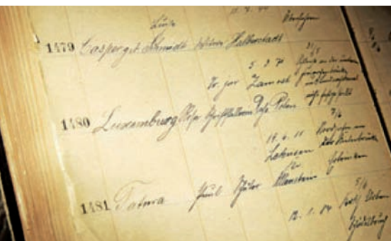
El llibre de registres mèdics de l'hospital Charité de Berlín.