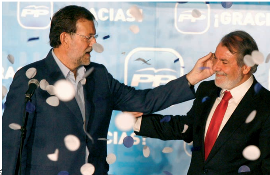
El president de Partit Popular, Mariano Rajoy, felicita el candidat Jaime Mayor Oreja, en saber-se els resultats i la victòria conservadora.

El 7J perfila un tercer duel Zapatero-Rajoy. El primer, avance o no els comicis prevists per al 2012, és l'únic socialista capaç de redreçar el decaïment del partit. El segon, victoriós també a Galícia, es consolida tot i l'oposició interna.