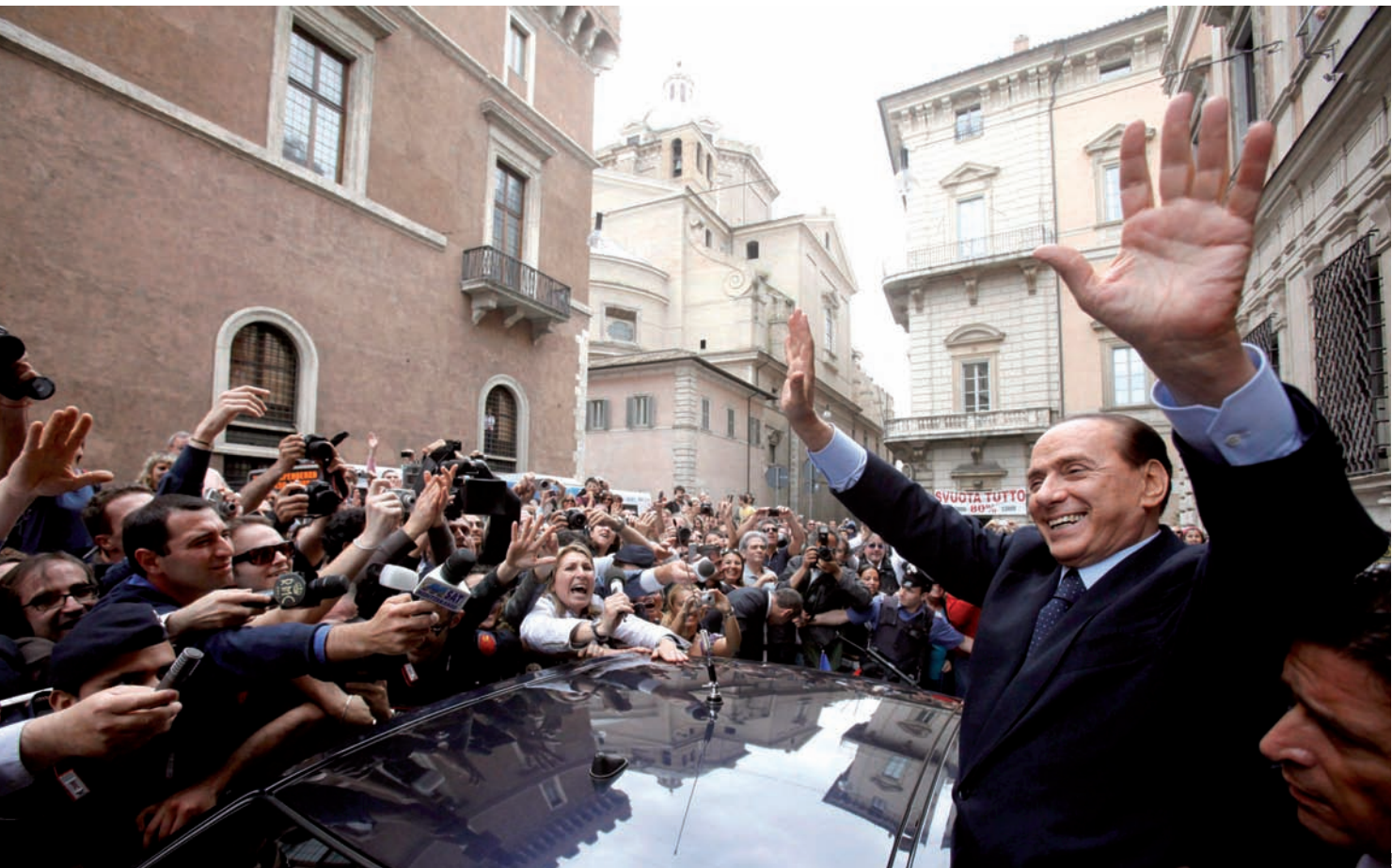
Malgrat els escàndols de les darreres setmanes, el partit liderat pel primer ministre italià, Silvio Berlusconi, ha guanyat a Itàlia.