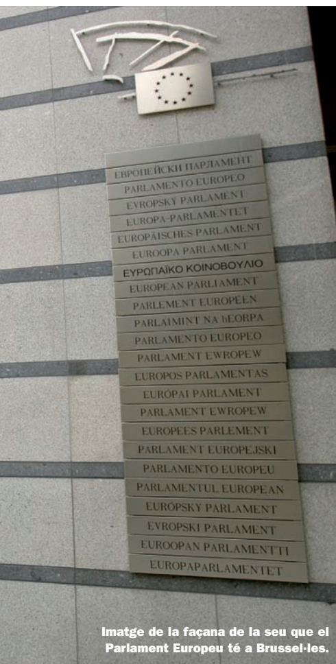
Imatge de la façana de la seu que el Parlament Europeu té a Brussel·les.

prosperitat i l'estabilitat als ciutadans europeus. Es tracta, de fet, d'un dels principis fundacionals de l'organització. Cal recordar que el projecte d'integració europea va néixer de resultes dels estralls causats per la Segona Guerra Mundial. La unificació de tots els països europeus és, de fet, un altre dels principals objectius de la UE; un procés que, tot i que l'organització compta ja amb 27 estats membres, encara no s'ha aturat, com ho mostren les converses sobre una possible futura adhesió que duu a terme la UE amb alguns dels països de l'ex-Iugoslàvia, o bé amb Turquia. Això a banda, la política de seguretat és un altre dels objectius que s'ha fixat la UE, tant en l'àmbit interior com exterior. Així, per tal de garantir la protecció dels estats membres i la seguretat de les fronteres exteriors, la UE ha reforçat la cooperació amb els aliats estratègics, sobretot dins el marc de l'OTAN. Internament, per tal de garantir que tots els ciutadans tinguin els mateixos drets